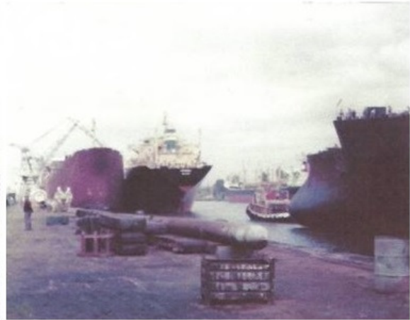
PUHOS TIL HØYRE UTEN BAUG