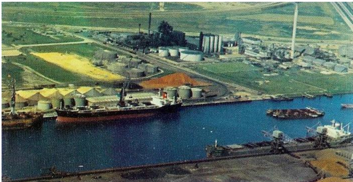
ROTTERDAM BOTLEK 22.mai 1965. Her ble min sjømannskarriere avsluttet!