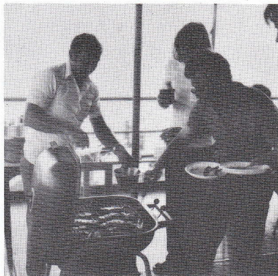
Grillaften på "Aimée". Fra venstre Blanco, Kristiansen og Nine.