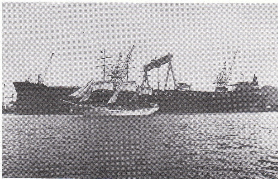
Stevnemøte mellom gammel og ny tid. Skoleskipet "CHRISTIAN RADICH" har ankret opp ved siden av "WIND ESCORT" som er klar for sin jomfrutur fra Malmø i november 1977.