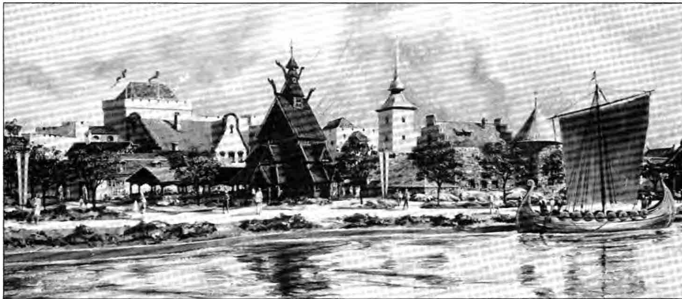
Slik vil Norge fremstå for de besøkende, med en kopi av Gol stavkirke som en sentral attraksjon.

ning er å plassere Norge på kartet som et selvstendig og interessant land i Skandinavia. Norge skal dessuten profileres som en moderne industrinasjon med rike historiske tradisjoner, et velutviklet og ressursrikt samfunn med en befolkning på høyt kunnskapsnivå og et land med vakker natur, høy levestandard og høy livsstandard.