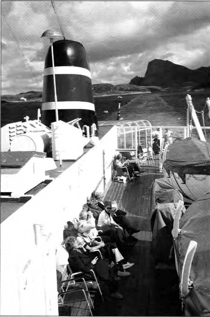
Med Nordenfjeldskes «Ragnvald Jan» i nordlige farvann.

nings- og bedriftsreiser, og sørge for optimale reiseopplegg, inkludert alle de former for service som bedriftene kan ønske. Dette er i starten blitt mottatt med stor tilfredshet.