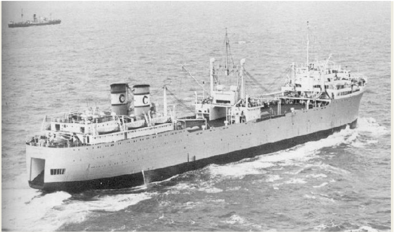
SFJ002194720001 MS/Fik THORSHAVET på vei til feltet.