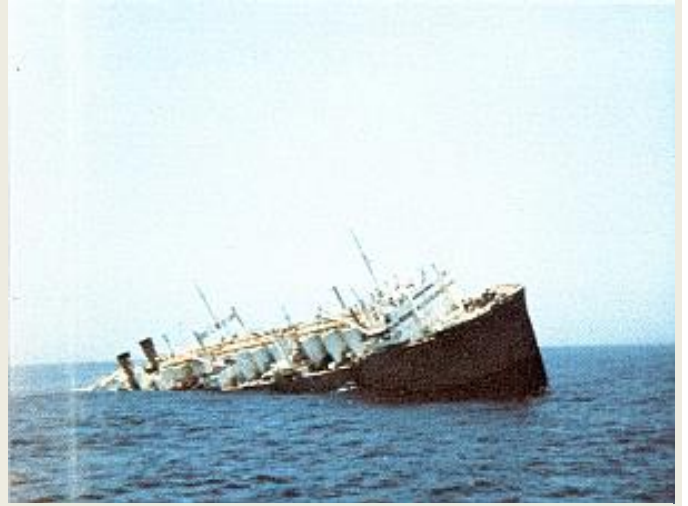
THORSHAVETS siste dramatiske minutter, nå som MS ASTRA