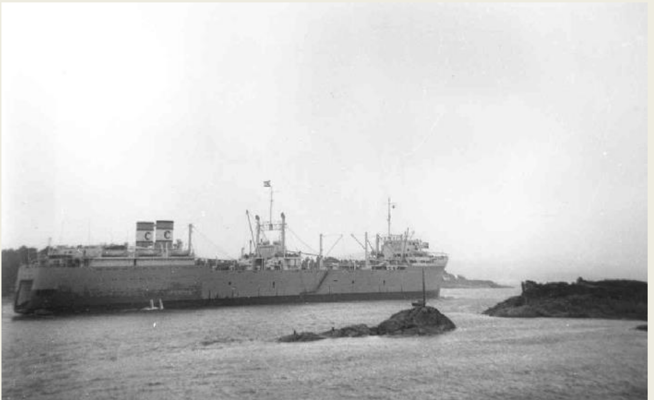
SFJ00219470120004 MS/Fik THORSHAVET forlater Sandefjord med kurs for fangstfeltet