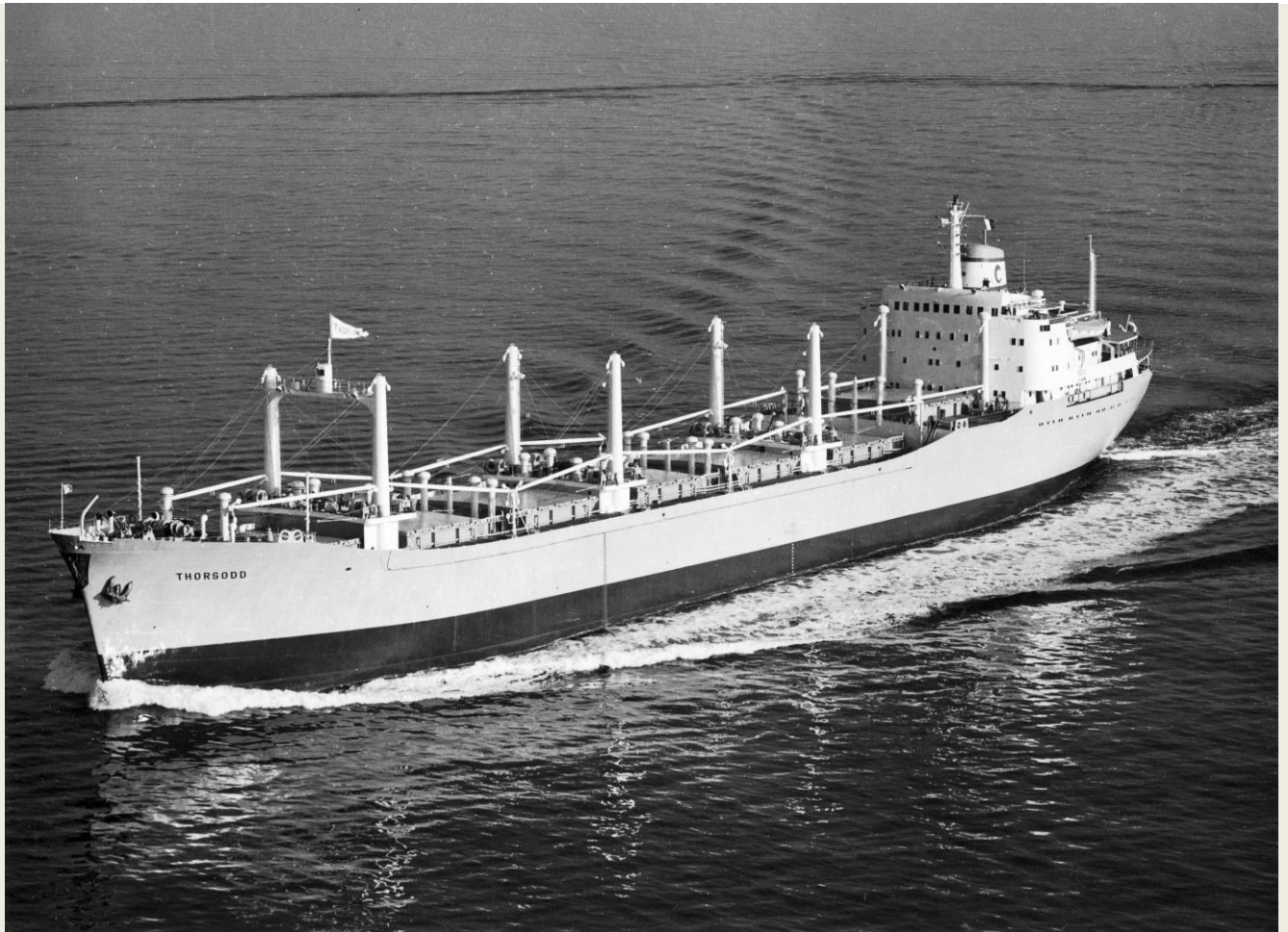
SFJ00219620220001 THORSODD.