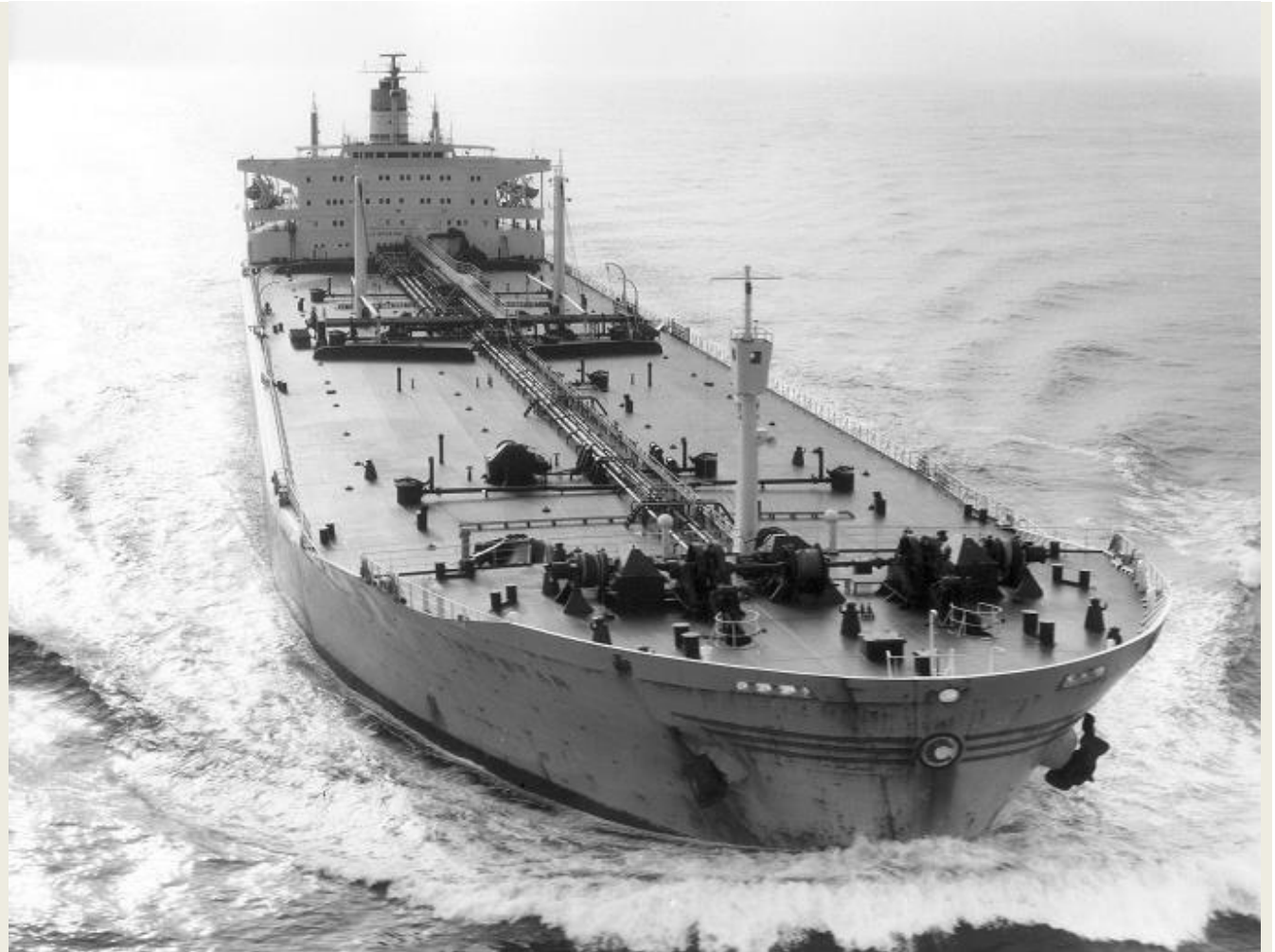
SFJ00219660120001 MT THORSTAR.