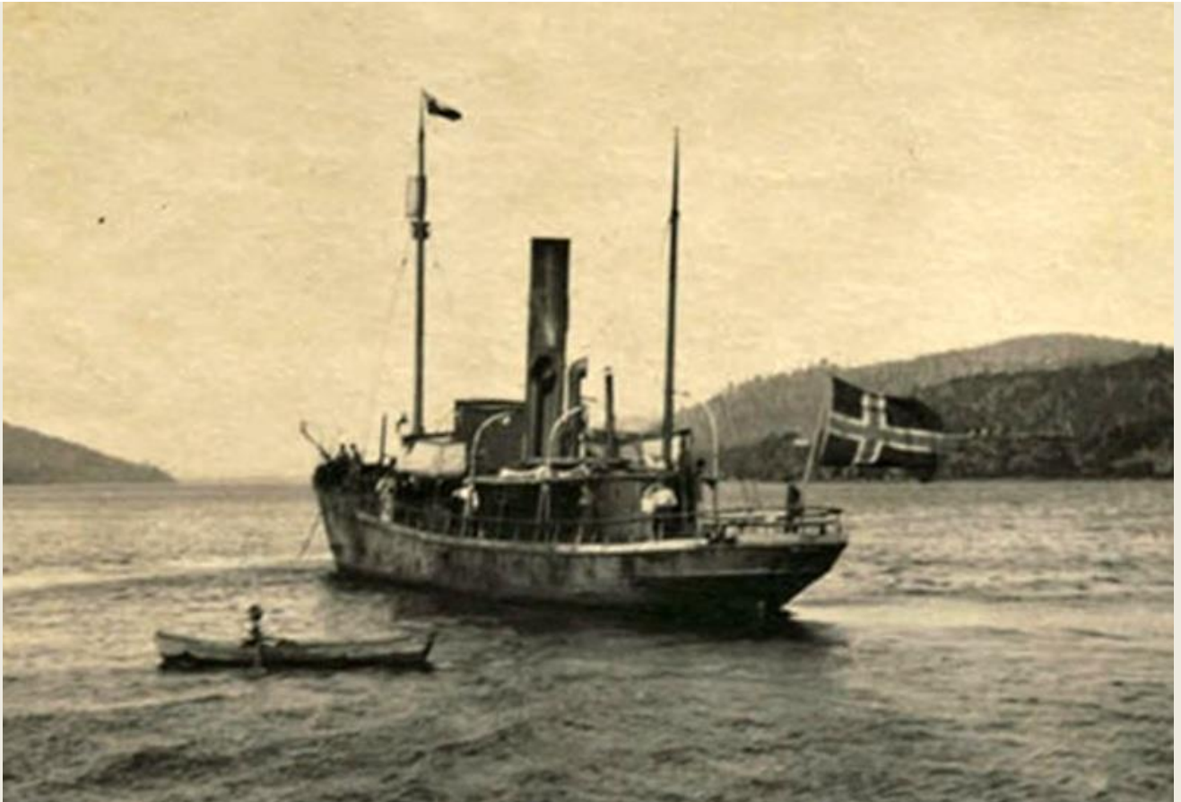
SFJ00319200420001 PENGUIN.