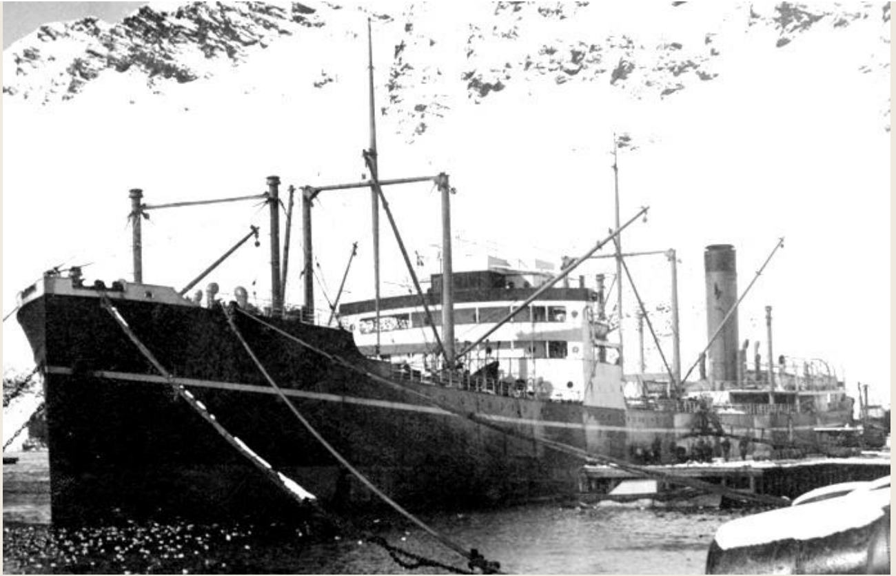
SFJ00319250120001 DT PEDER BOGEN.