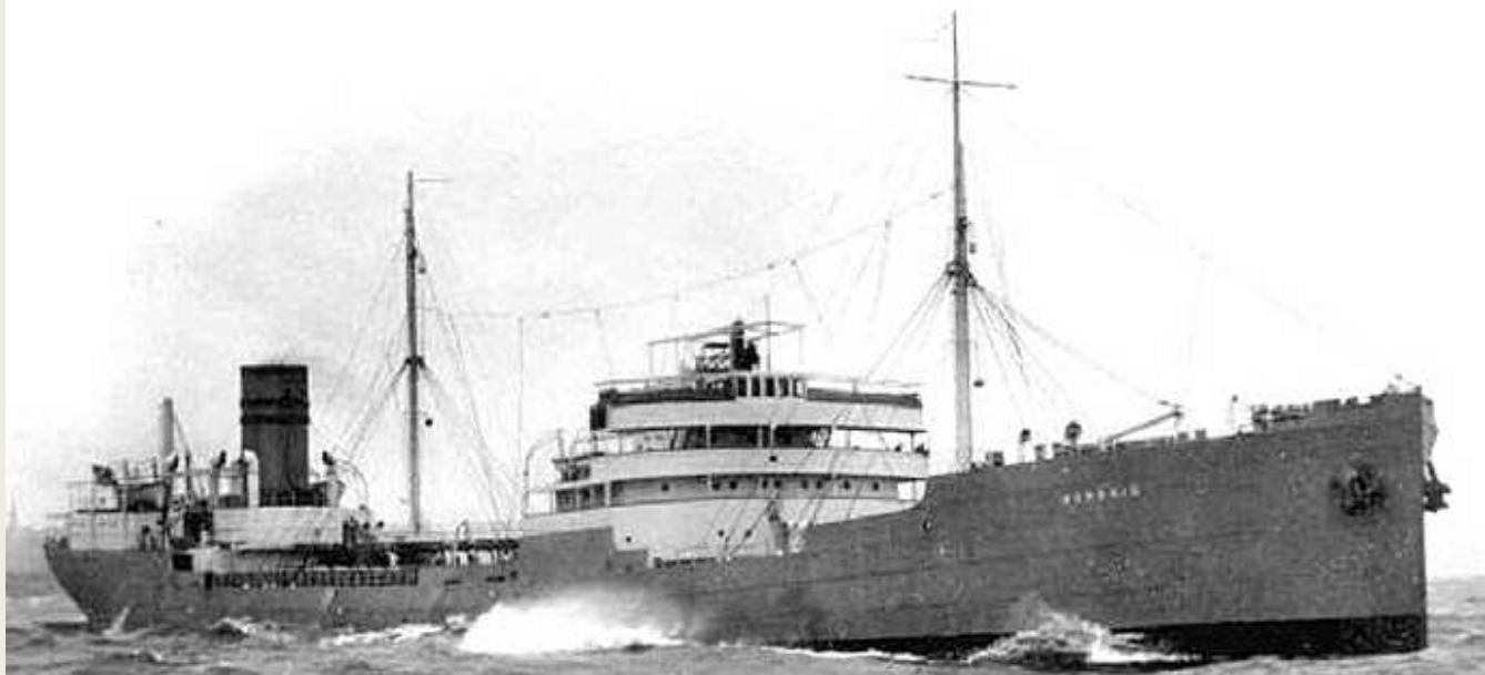
SFJ00319300220001 NORBRIS.