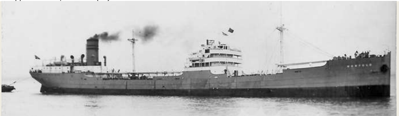
SFJ00319300420002 NORFOLD. Foto fra et gammelt julekort.