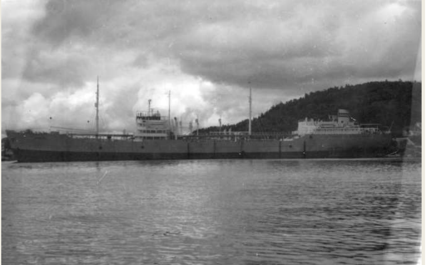
SFJ00319500120002 MT VESTFOLD fortøyd ved Huvik, Sandefjord.