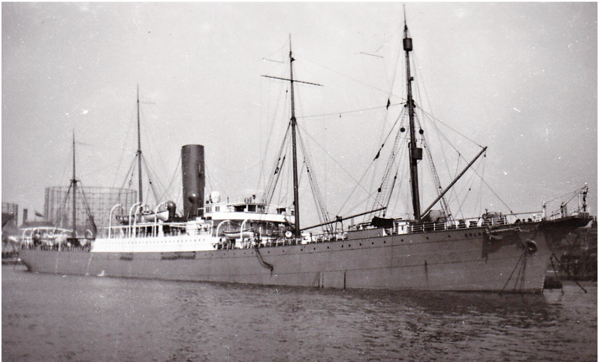
SFJ00219280320004 TORODD SOM COLONIA (1)