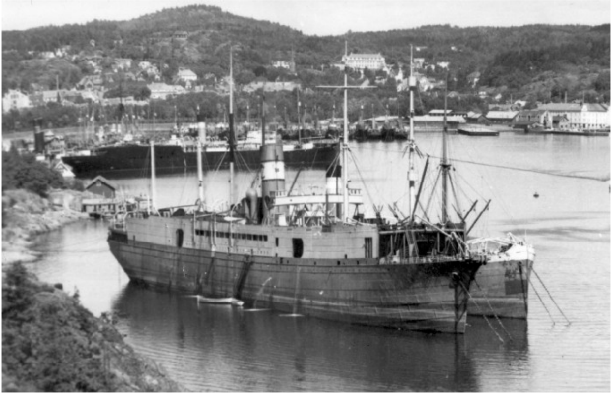
SFJ00219280320001 TORODD (2) i opplag i Sandefjord på 30-tallet. Man kan skimte kokeri/transportbåt TORNQUIST på utsiden.