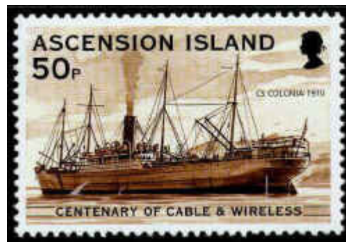
SFJ002192820005 DS/FIK TORODD som DS COLONIA på frimerke fra ASCENSION ISLAND