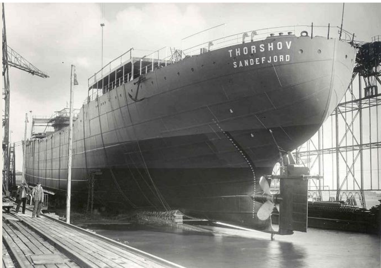
SFJ00219350111801 THORSHOV. Klar til sjøsetting.