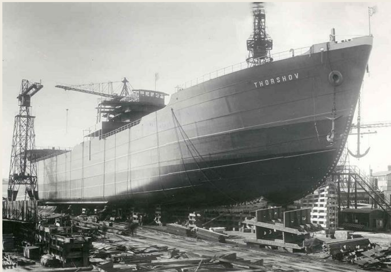
SFJ00219350111801 THORSHOV. Klar til sjøsetting.