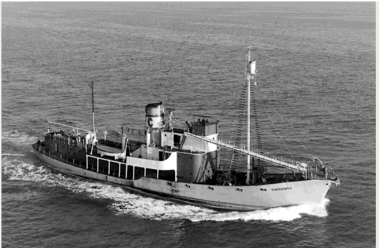
SFJ00219410420001 DS /Hvb THORDØNN.