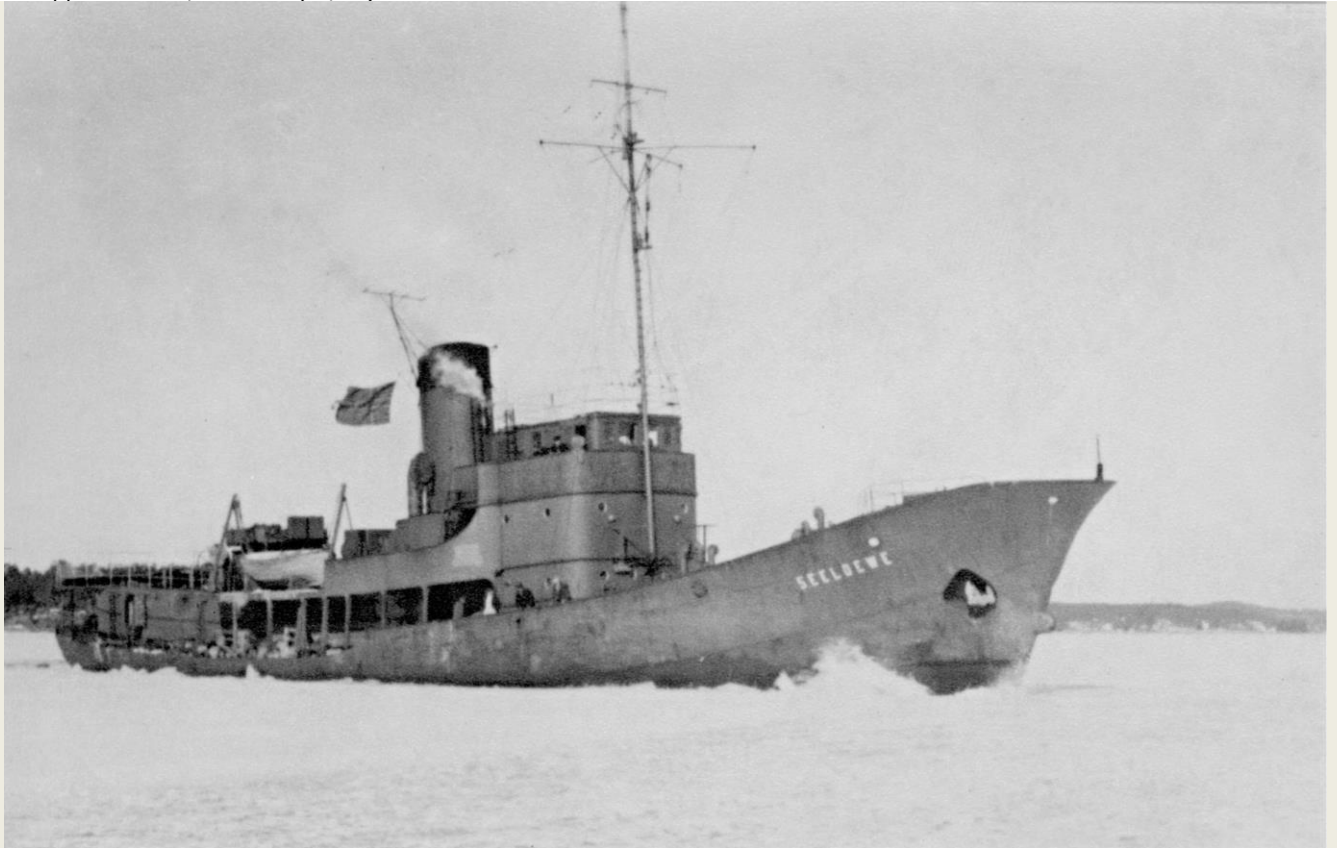
SFJ00219410420002 DS/Hvb THORDØNN som SEELÖWE.