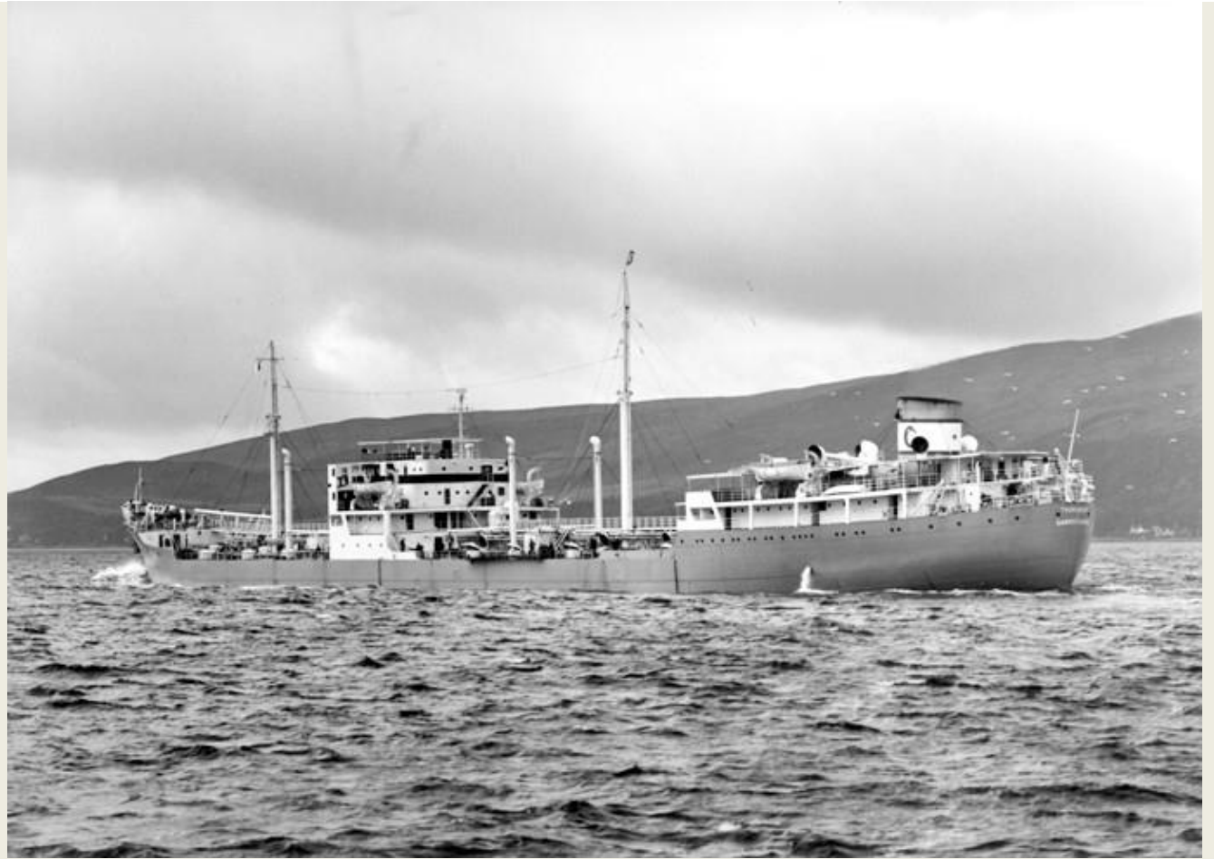
SFJ00219510320004 THORSKOG.