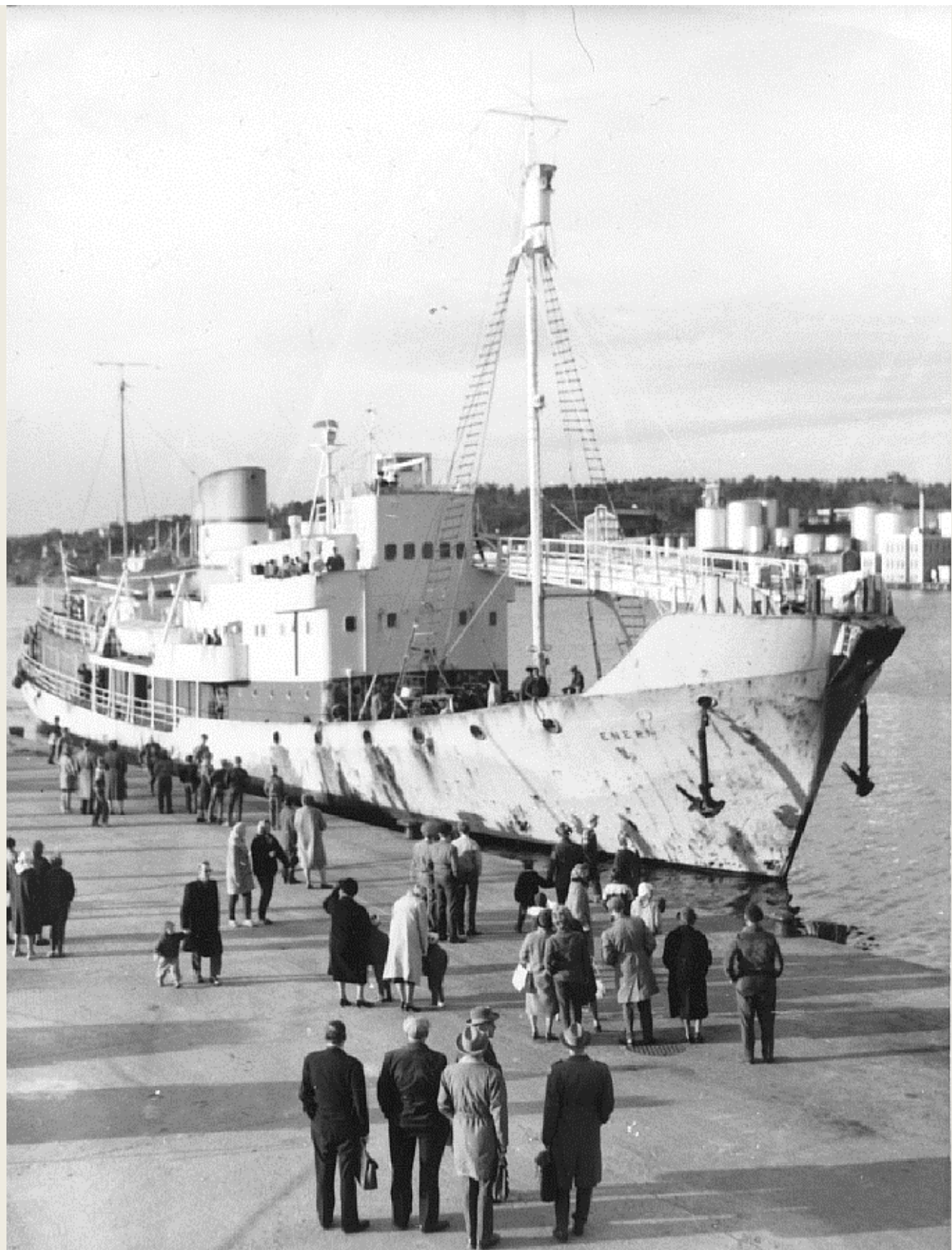
SFJ00219520120002 ENERN (1) MS/HVB ENERN ankommer Thorøya fra fangstfeltet. Vårens eventyr for mange i Vestfold.