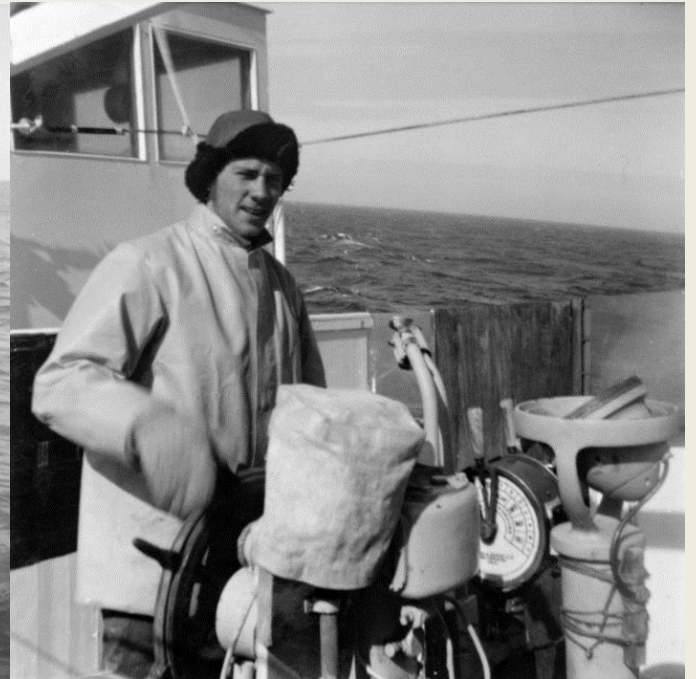
SFJ00219520155001 ENERN (26) Fast fisk!