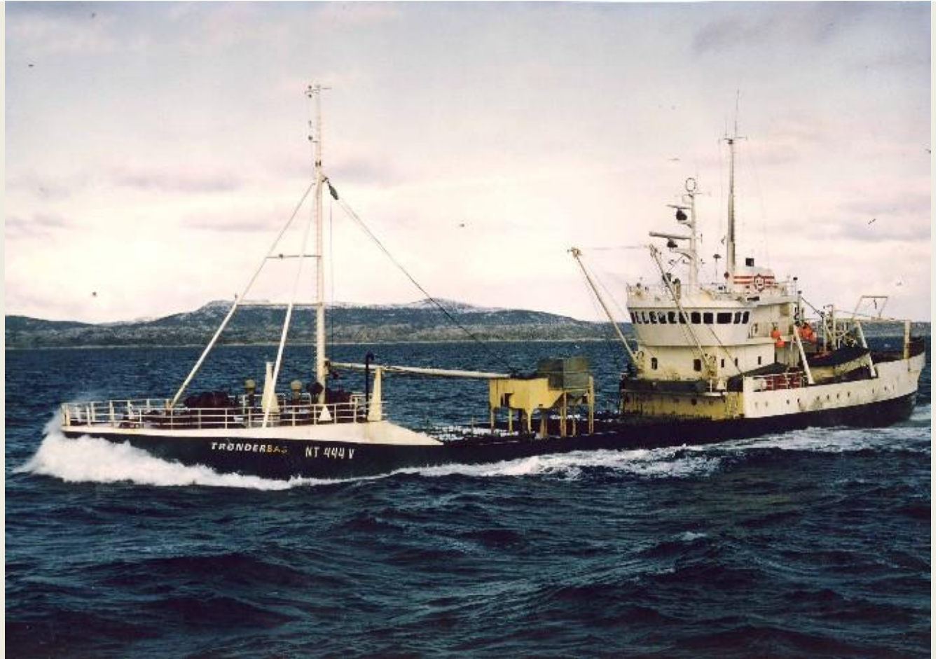
SFJ00219520120004 ENERN SOM TRØNDERBAS (1) som TRØNDERBAS i 1976