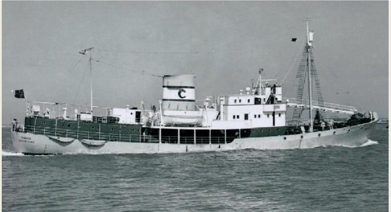
SFJ00219520120001 MS/Hvb ENERN på vei mot sør.