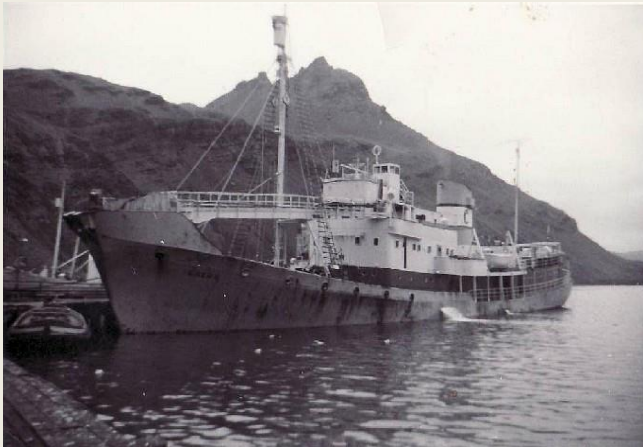
SFJ00219520120002 ENERN (2) besøker Syd-Georgia i 1962.