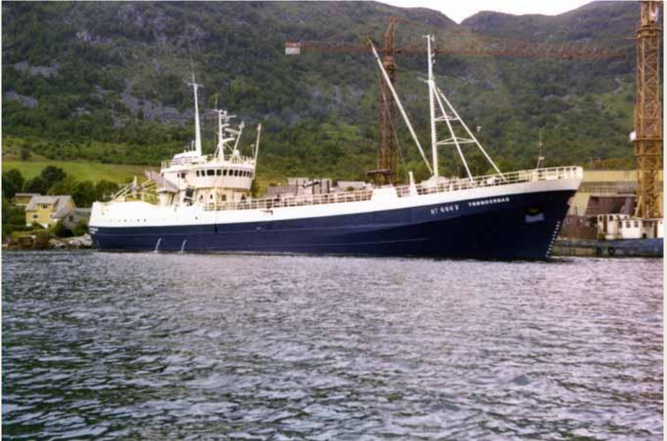
SFJ00219520120004 ENERN SOM TRØNDERBAS (2). TRØNDERBAS etter ombygging til shelterdekker i 1977.