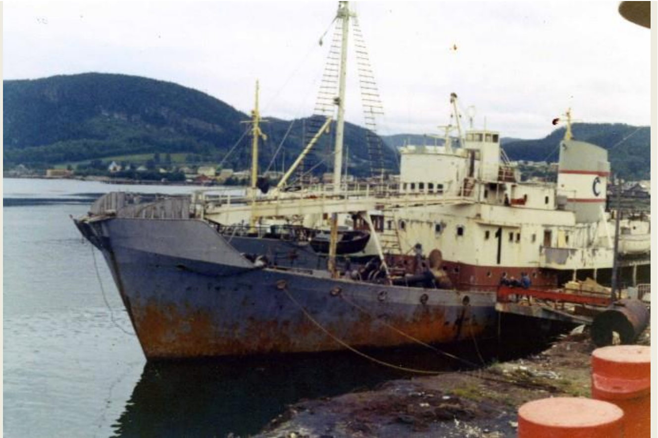
SFJ00219520120003 ENERN (3) for ombygging i Hommelvik.