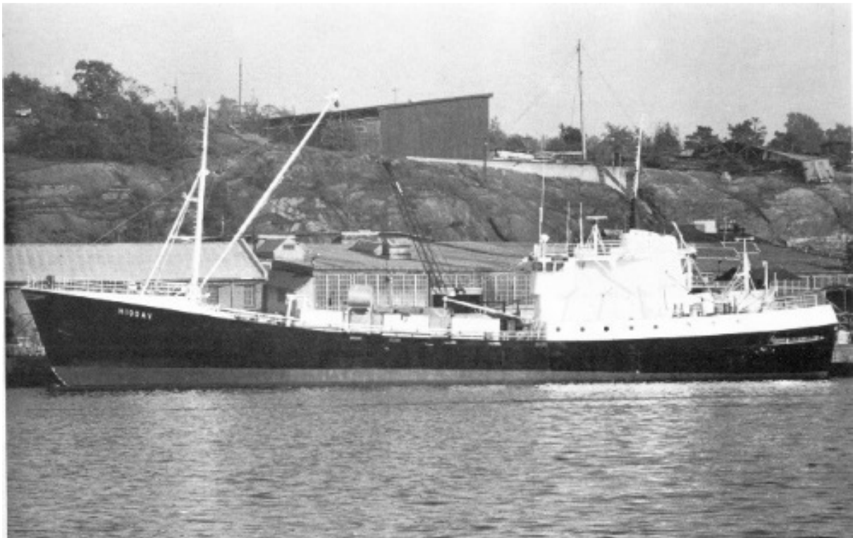
SFJ00219520520002 DS/Hvb NEBB som fiskebåt ASTRID BAKK (H-190-AV)