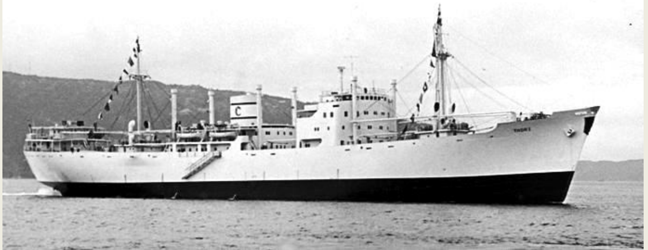
SFJ00219550220001 THOR I. Bilde fra Thor-Glimt.