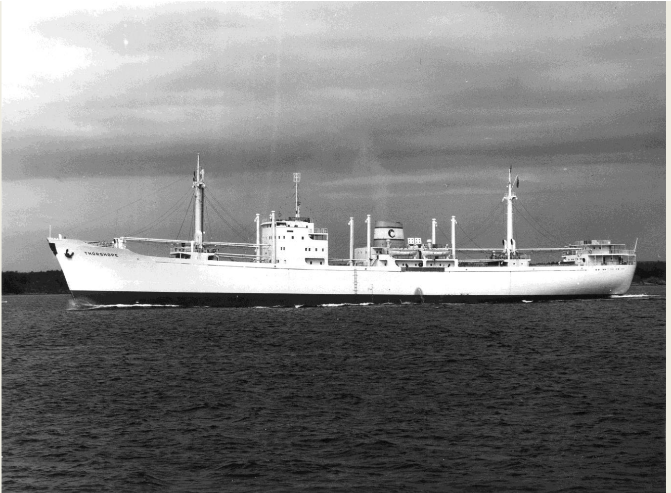
SFJ00219580120001 THORSHOPE.