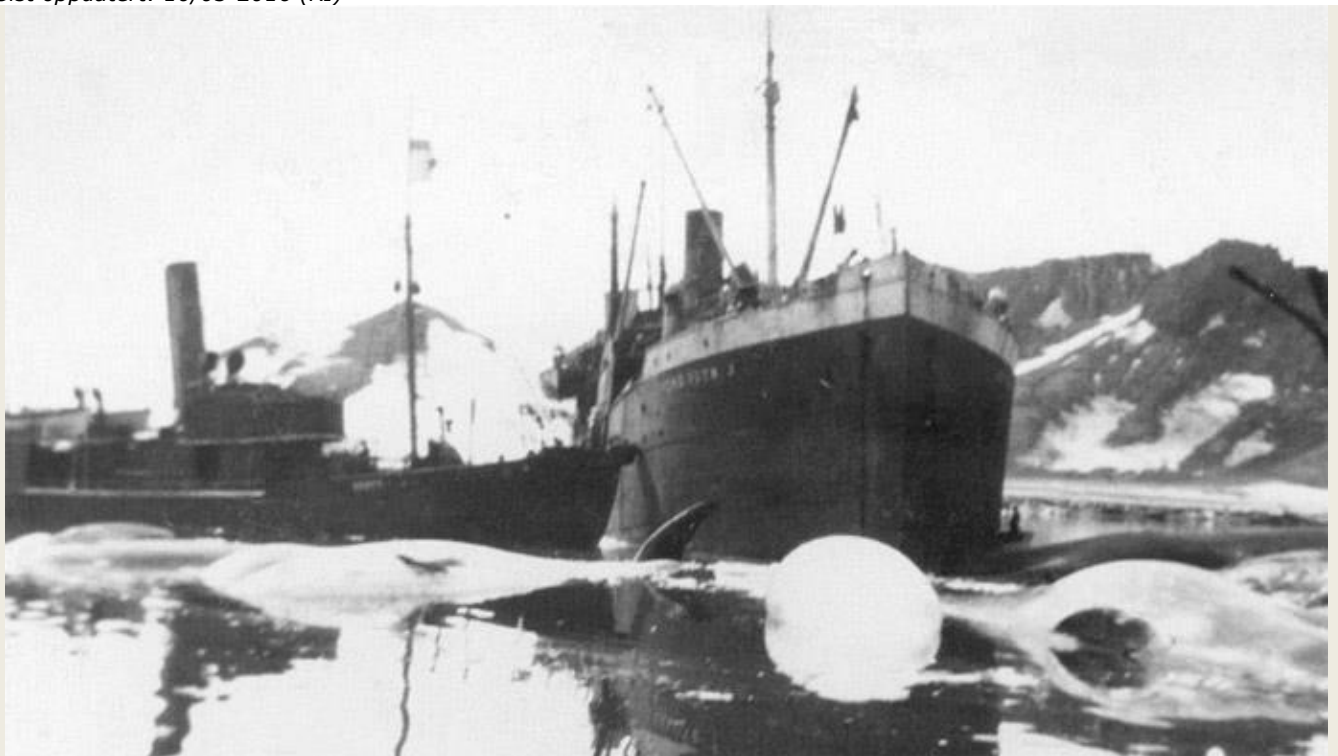
SFJ00319140220002 DS/Fik SVEND FOYN I. SELVIK ER INNE OG LEVERER HVAL.