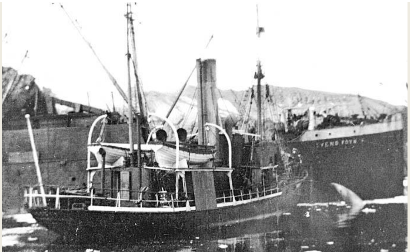
SFJ00319140920002 DS/Hvb SCOTT leverer hval til kokeriet SVEND FOYN I .