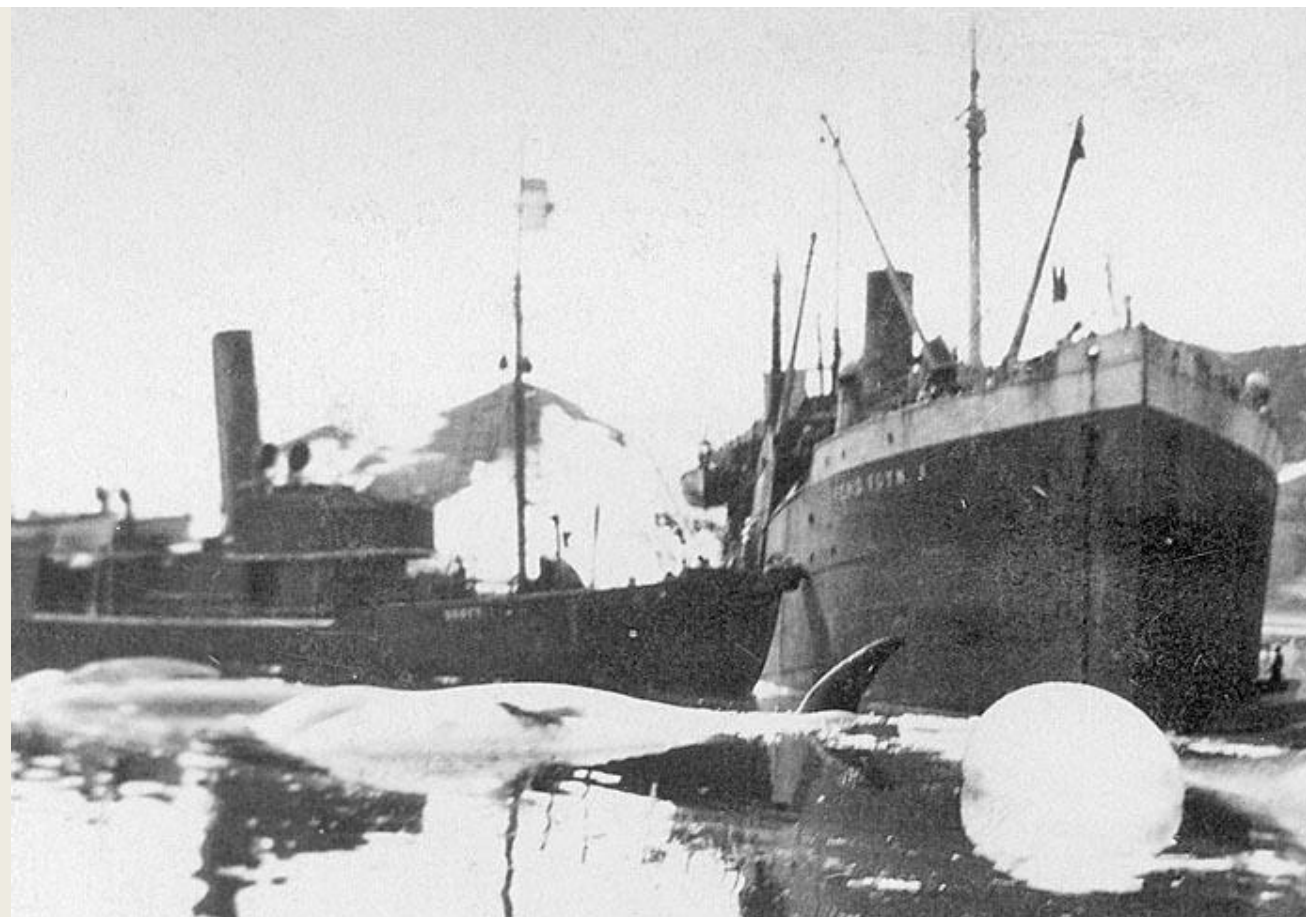
SFJ0031914092003 DS/Hvb SCOTT leverer hval til kokeriet SVEND FOYN I.