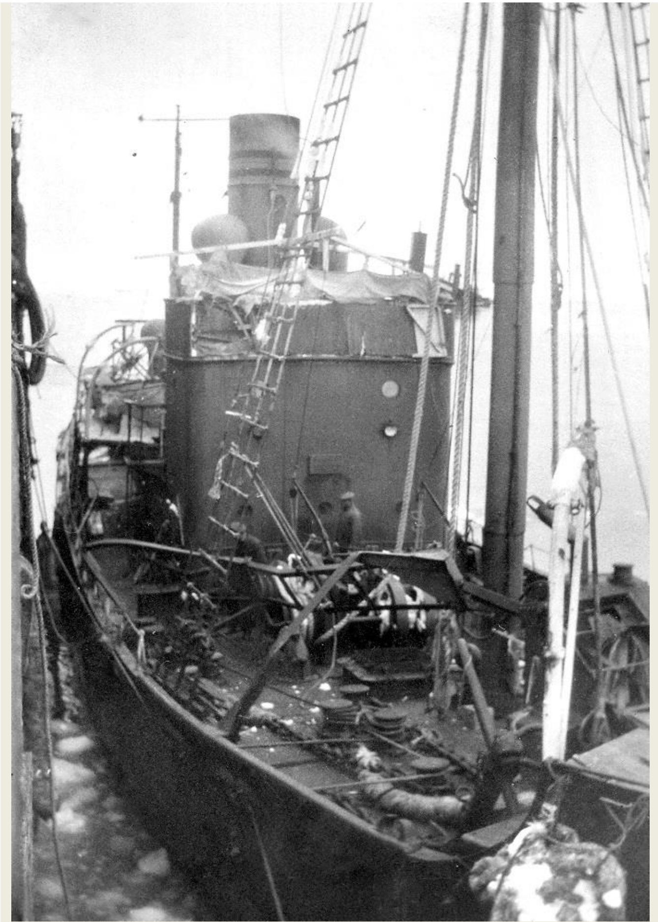
SFJ00319250220003 ROKK etter monstersjøens herjinger i februar 1934.