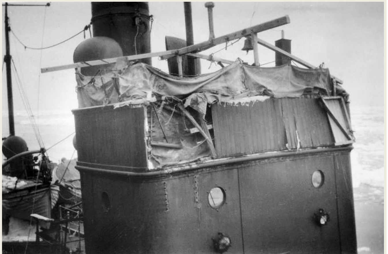
SFJ00319250220005 ROKK etter monstersjøens herjinger i februar 1934.