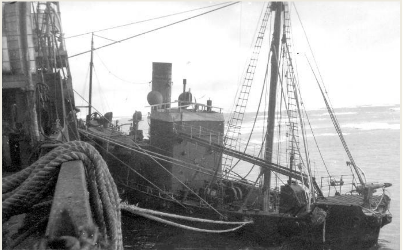
SFJ00319250220007 ROKK propellskift i sjøen