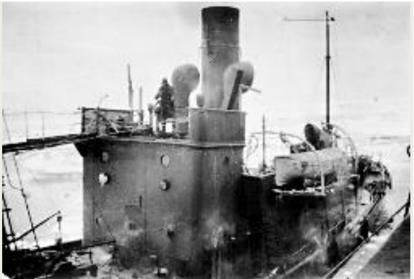
SFJ00319250220006 ROKK etter monstersjøens herjinger i februar 1934.