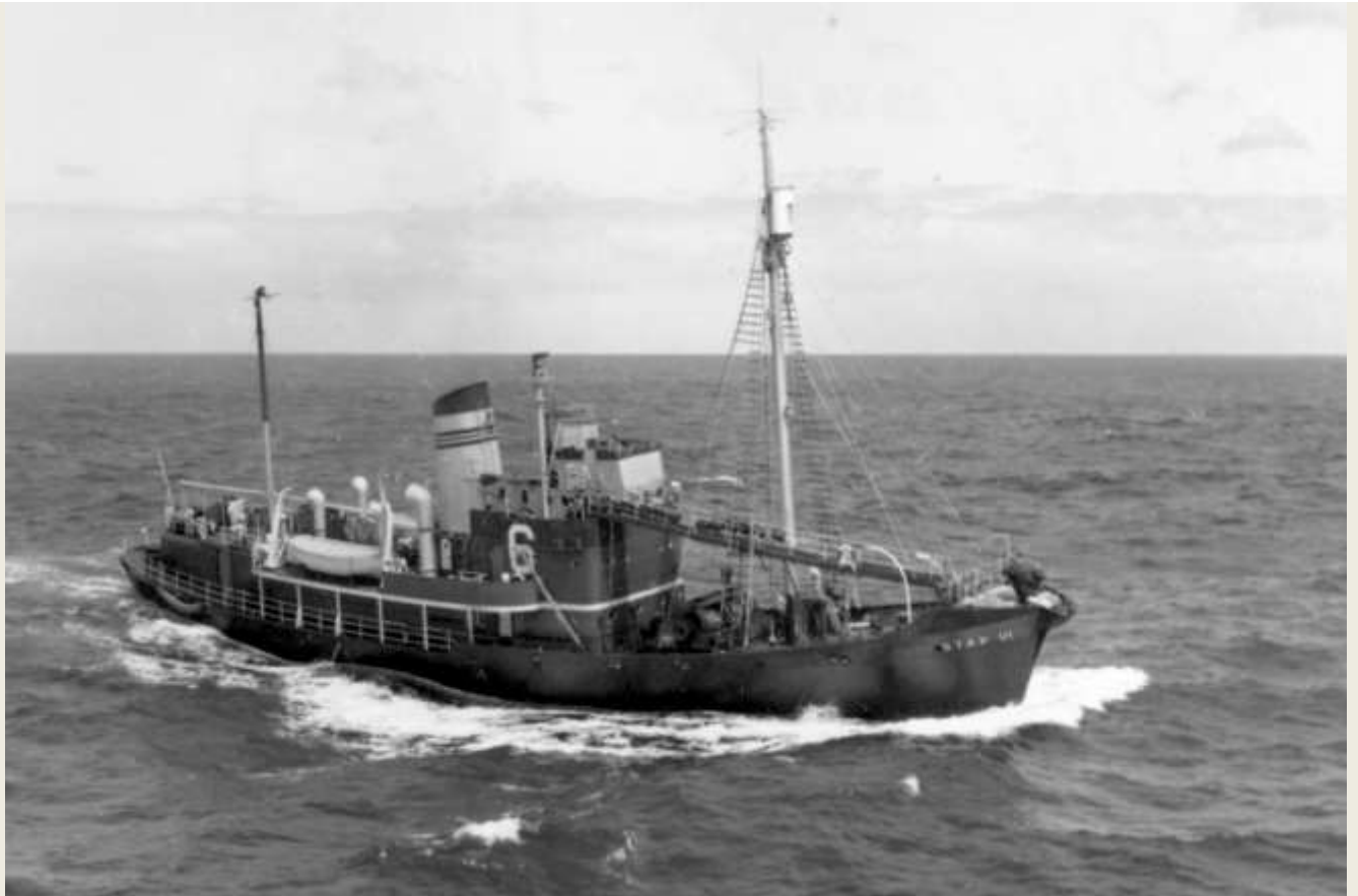
SFJ00319480420001 DS/HVB STAR VI.