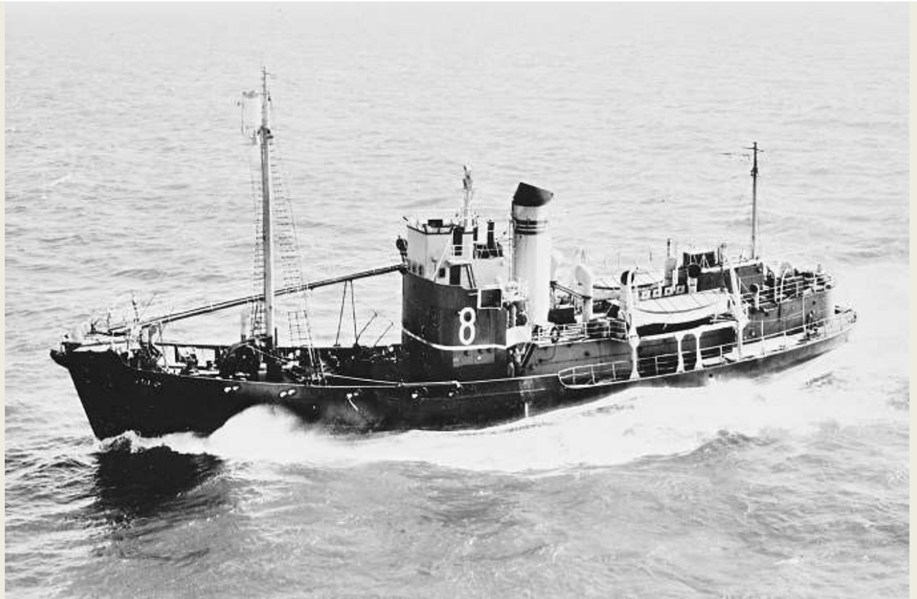
SFJ00319480620001 DS/HVB STAR VIII