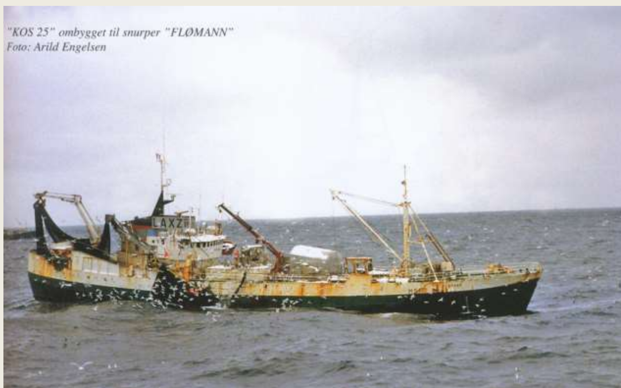
SFJ00319480720002 DS/HVB STAR I (II). Fra boken «På alle Hav – Skipene i Anders Jahres rederi». Her som fiskefartøy FLØMANN