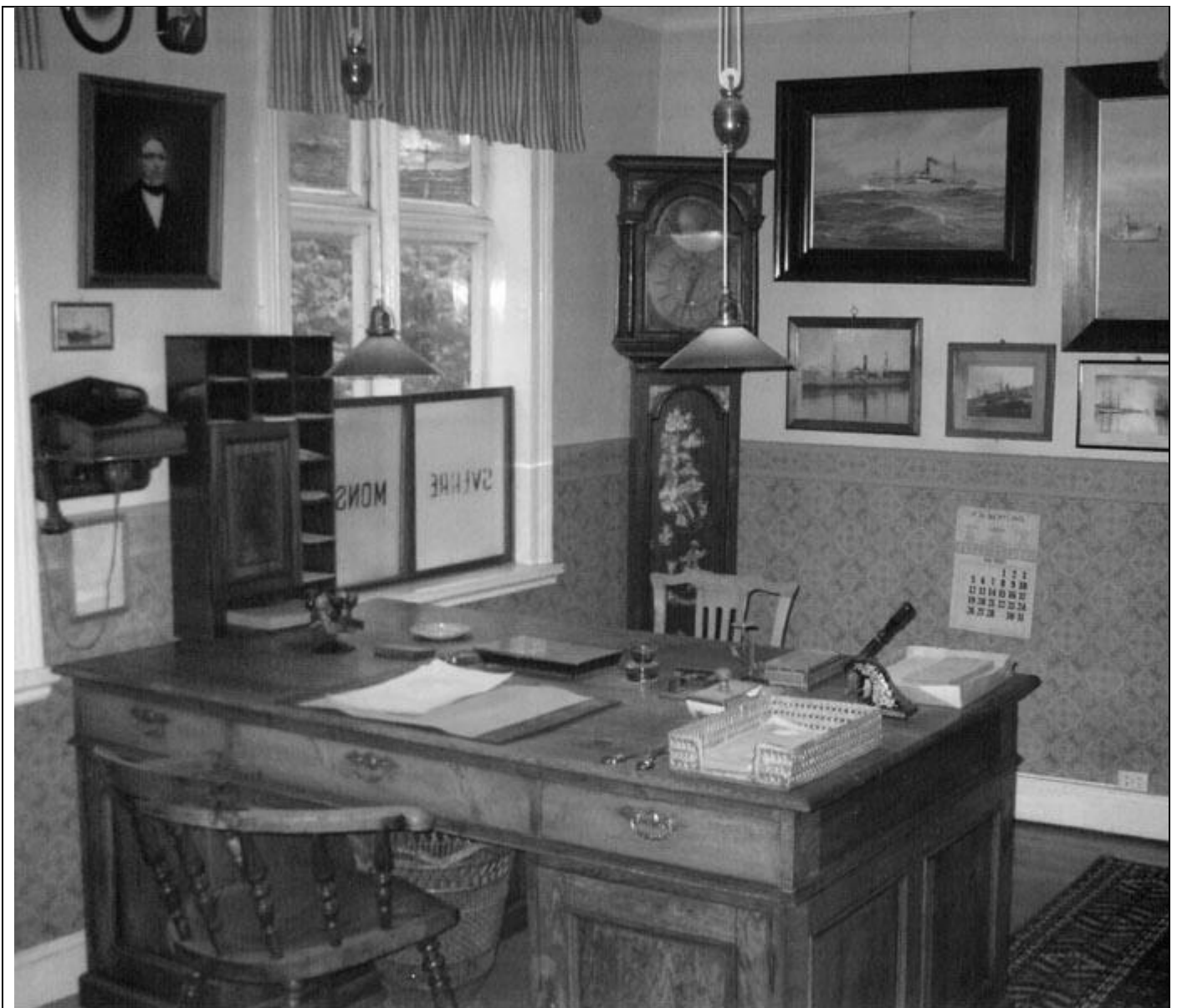
Kontoret til Sverre Monsen på Stavanger Sjøfartsmuseum