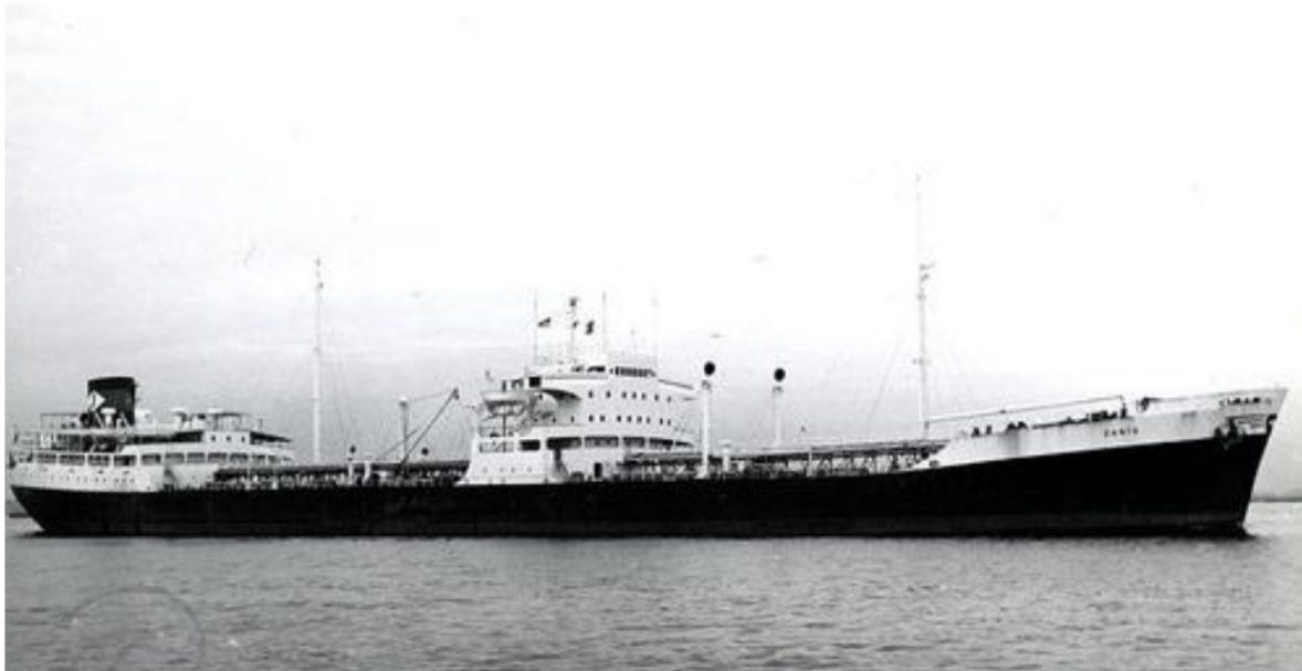
M/T SIROCCO. Tidligere norske CANTO av Arendal bygget i 1958 ved Vickers-Armstrongs Ltd, for A/S Jensen's Rederi IV.