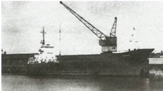
De containercoaster „Nassau“, afgemeerd in Harlingen om daar tot cruiseschip te worden verbouwd.