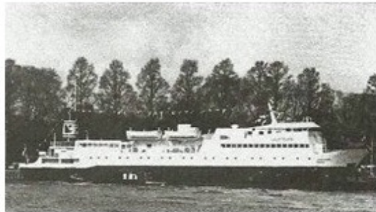
AAN DE PARKKADE

Klokken 11, neste morgen. Telefon. Skulle ut til « Vacationer » igjen. Den var flyttet fra Harlingen til Parkkade i Rotterdam. Like i nærheten av Maastunnel og Sjømannskirke. Forstår ikke dette her. Hvorfor kjøre 600 kilometer fram og tilbake til Harlingen når skute skal til Rotterdam? Ordre fra oppdragsgiver var svaret. Det ble 8 paller til. Sengetøy, bysseutstyr, kniver, gafler, matfat, og hva som skal til for å betjene passagerer. Man ble fort klar over at forholdene ikke var de samme som dagen i forveien. Har ikke sett noe mer til denne finske damen. Savnet henne. Istedenfor en hollender på bakken som ga ordre om hva som skulle ombord først. De ble nødt til å bruke egen kran denne gang. Måtte halvere flere av disse pallene for å få det til å løfte. Ga faen i han tullingen på bakken. Liker ikke å få ordre fra en NOBODY. Det var slutt på servise fra min side. Ble lei hele dritten. Ferdig i 4 tiden.