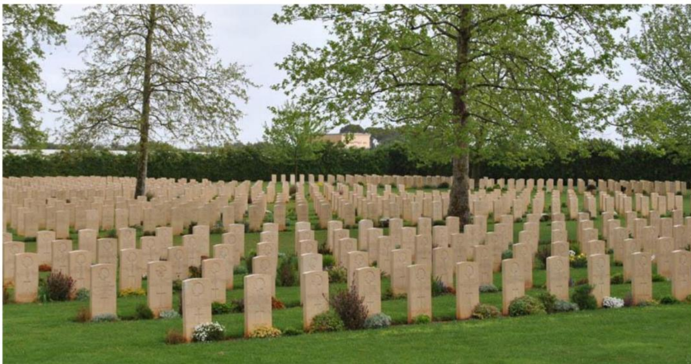
Under en navnløs gravstein på krigskirkegården i Bari hviler en finnmarking.