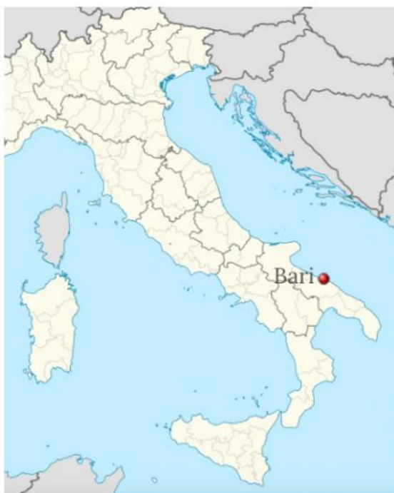
Kartet viser hvor havnebyen Bari ligger.