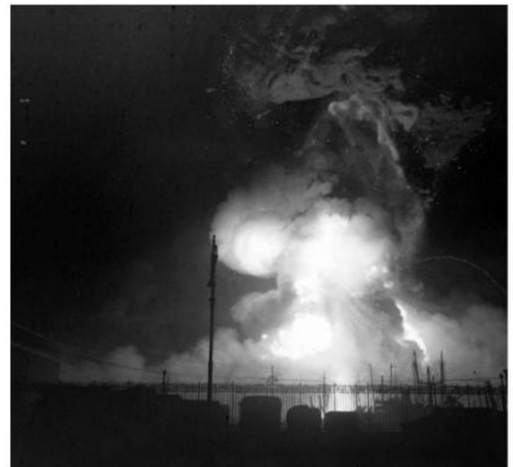
Et tankskip forsvinner i et inferno av flammer under angrepet på Bari.