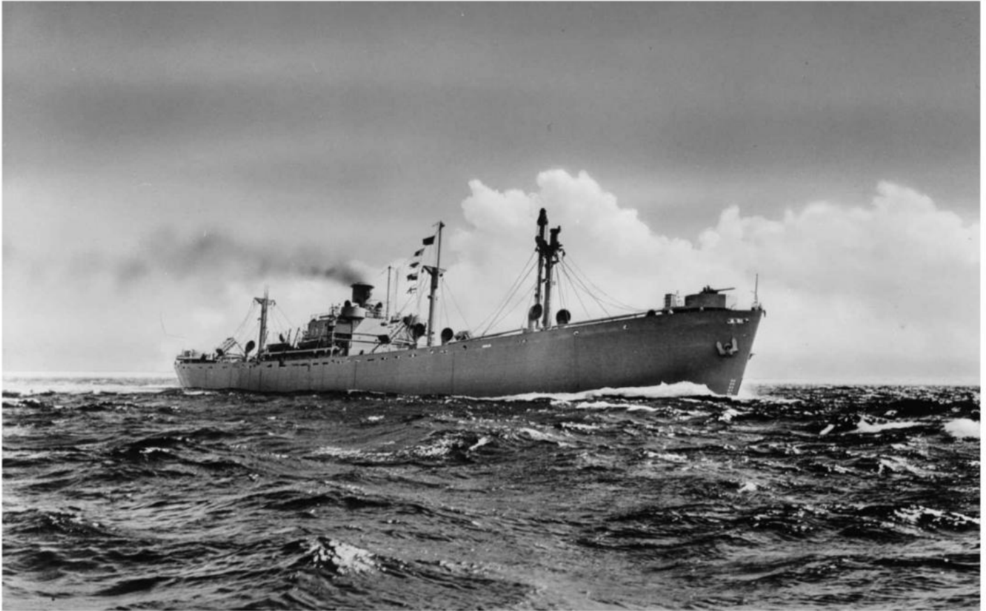
John Harvey var lastet med sennepsgass da skipet gikk i luften om kvelden den 2. desember 1943. Bildet viser et skip av samme type.