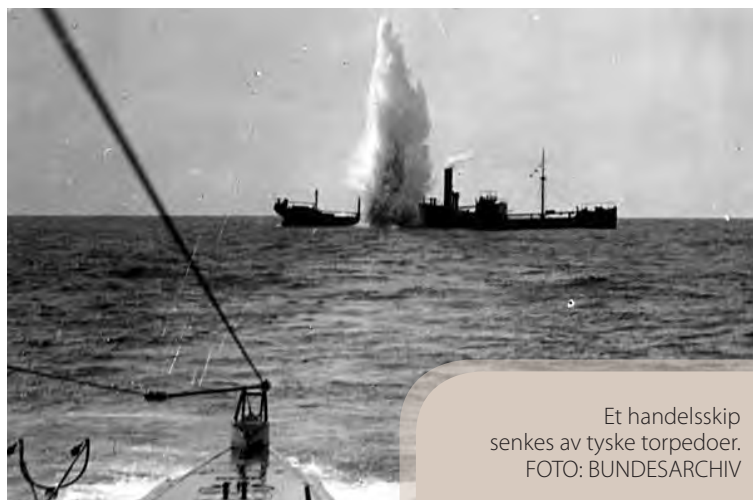
Et handelsskip senkes av tyske torpedoer.