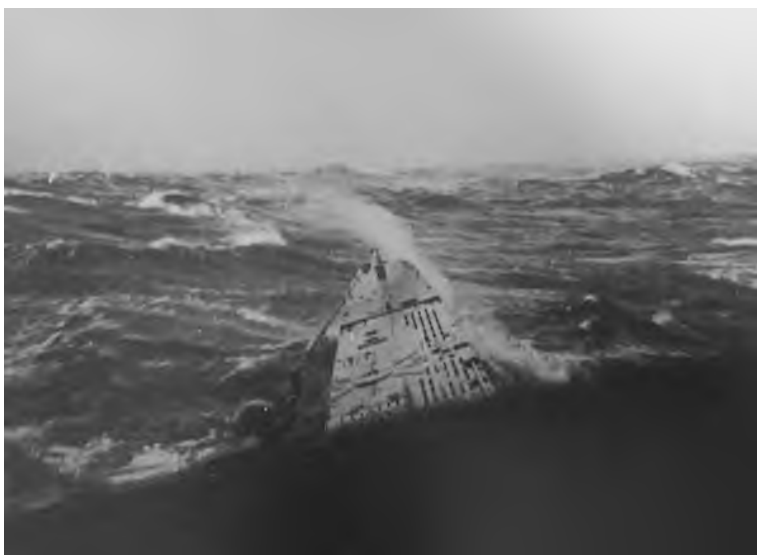
U-576 på patrulje i tung sjø.