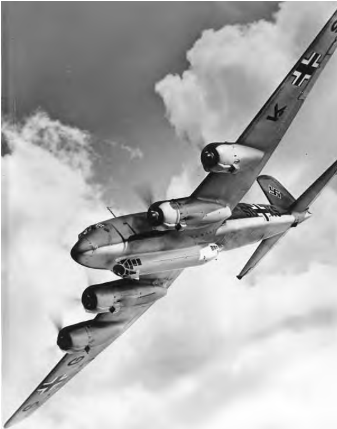
Focke-Wulf 200 Condor var et transportfly som ble ombygd til bombefly under krigen. Flyene utgjorde en stor fare for de allierte konvoiene.