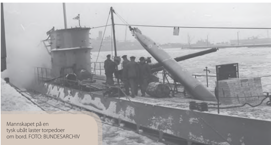
Mannskapet på en tysk ubåt laster torpedoer om bord.

De overlevende ble ført i land i Greenock, Storbritannia.