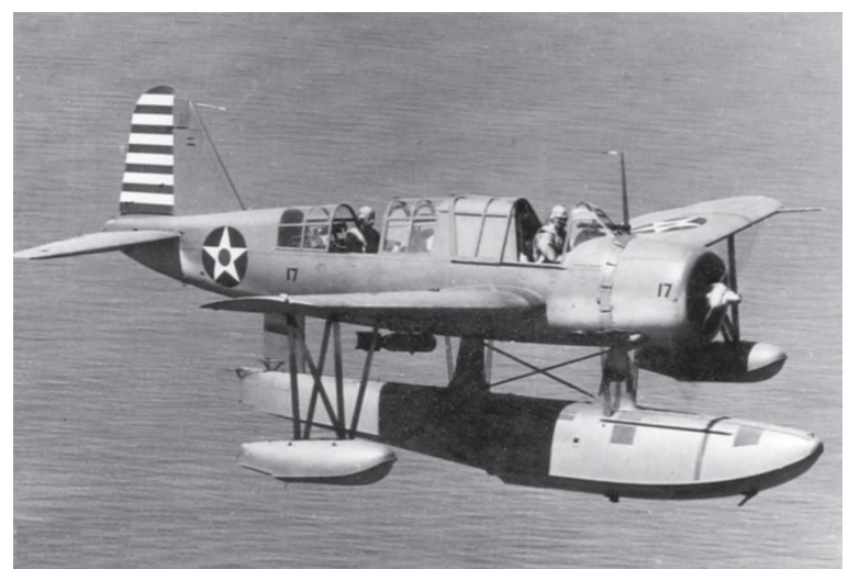
Observasjons-fly av typen Vought OS2U Kingfisher senket U-576.