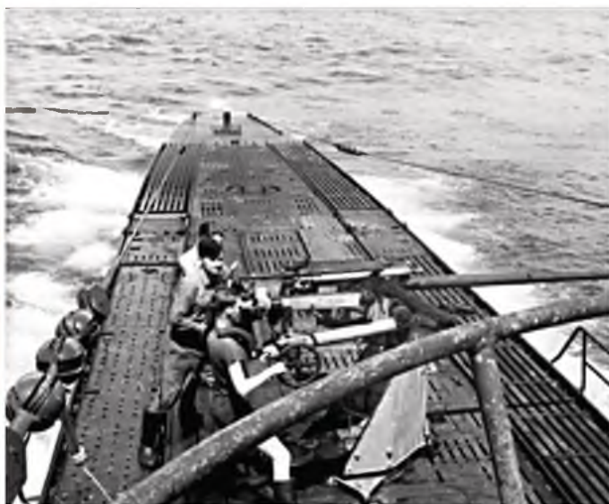
Skyttere bemanner en 3,7 cm SK C/30 luftvernkanon på dekk, samme type kanon ble brukt mot M/T Finnanger da hun ikke ble senket av torpedo-treffene.