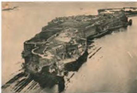
Tyskerne hadde en ubåt-base med navn Nord III på Helgoland. Det var fra denne U-158 dro på patruljen som endte med at M/T Finnanger ble senket.