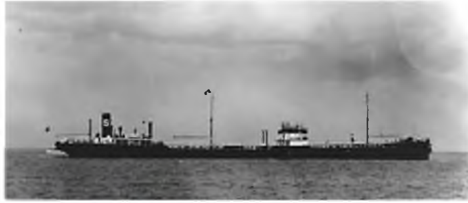
M/T Finnanger ble torpedert og skutt i senk av U-158 søndag 1. mars 1942.