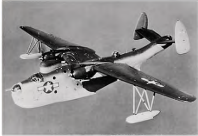
Et fly av typen PBM Mariner senket U-158 den 30. juni 1942.