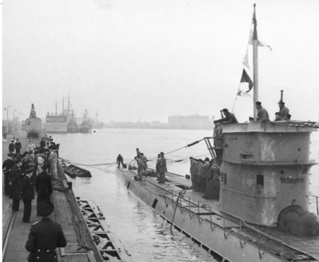
En ubåt av samme type som U-38 ved kai i Wilhelmshaven.

dem til unnsetning klokken kvart over seks om morgenen. Livbåtene befant seg da ved Scillyøyene 45 kilometer vest av Cornwall.