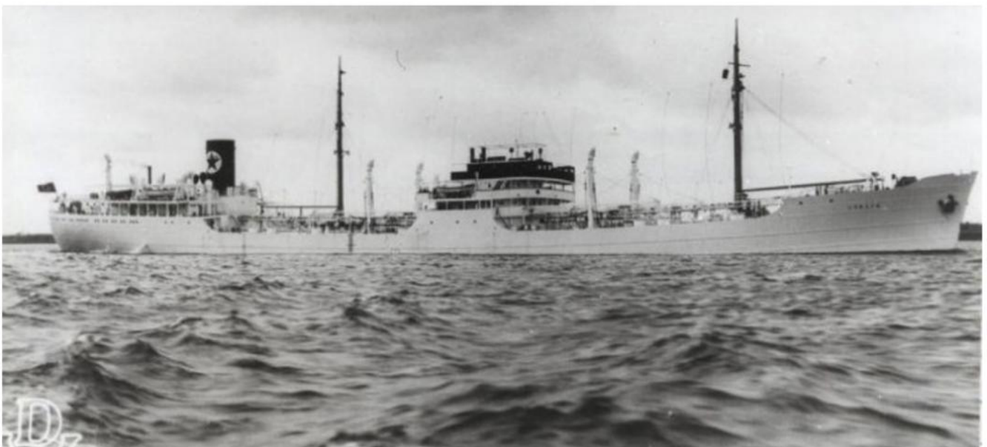
Tankskipet Italia, hvor Tor Aune var om bord, ble til et inferno i flammer 15. juni 1940.

Denne tok de på slep. Det britiske krigsskipet HMS Fowey kom