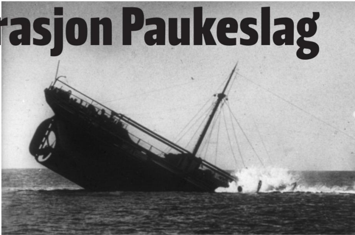
Torpedoene rammet. Her synker et ukjent dampskip etter å ha blitt truffet.

Hver mann hadde også egen livredningsvest i lugaren.