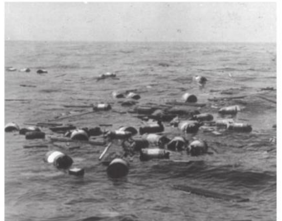
Etter tyskernes intensive jakt på handelsfartøy mistet mange norske og utenlandske sjømenn livet. Vrakgodset som fløt i sjøen var et taust vitne om kampen for å overleve.