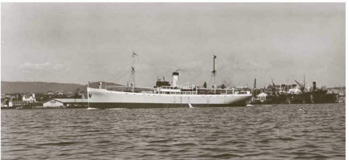
Dampskipet William Hansen ble torpedert i 1942, to finnmarkinger omkom.