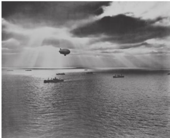
Eskorte av konvoier kunne ha avgjørende betydning, dampskipet William Hansens manglende eskorte ble skjebnesvanger.

Rapport avgitt av Båtsmann Karl Klausen, St. Johns Newfoundland 26. januar 1942 Sjøforklaring D/S William Hansen 26. juni 1942, Halifax Summary of R.C.A.F. Attack on U-Boat, Department of National Defence, Directorate of History and Heritage Folketelling 1910 for 2016 Hammerfest herred, Riksarkivet/Digitalarkivet Krigsseilerregisteret.no Sjohistorie.no Uboat.net Wrecksite.eu side3.no/historie/operasjon-pauke-slag-6782342