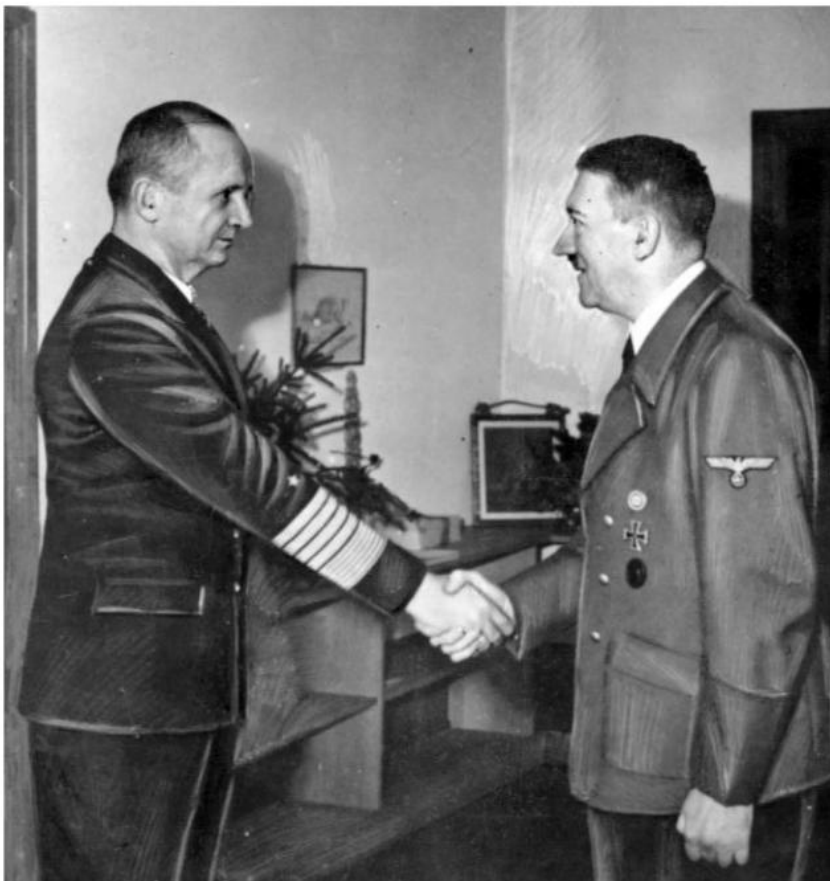
Storadmiral Karl Dönitz møtte Adolf Hitler i 1945 kort tid før Hitler begår selvmord.