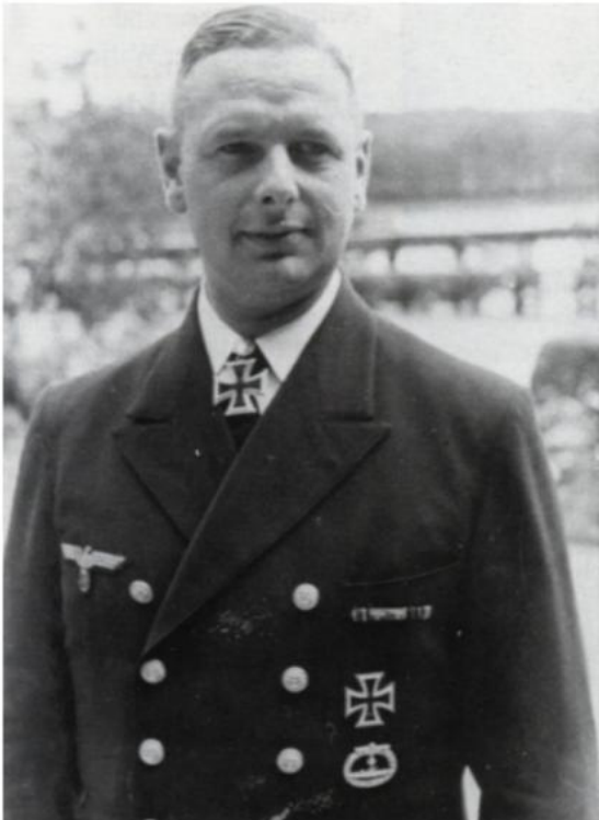
Kommandøren på U-103 ble høyt dekorert for å ha senket 35 allierte skip og skadet to.