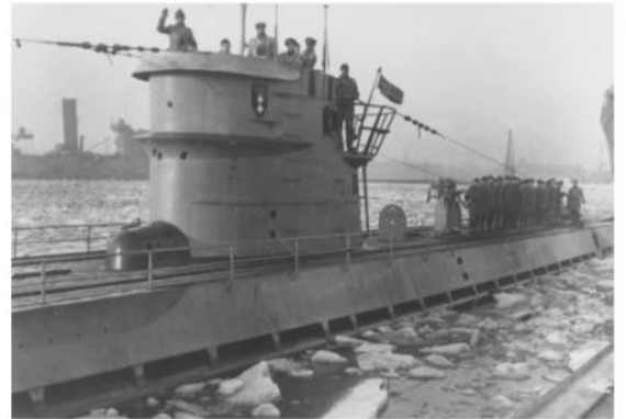
En ubåt av samme type som U-103 legger fra kai i Tromsø.