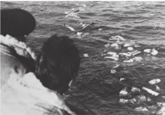
Tysk ubåt-mannskap betrakter vrakgods etter en vellykket torpedering.