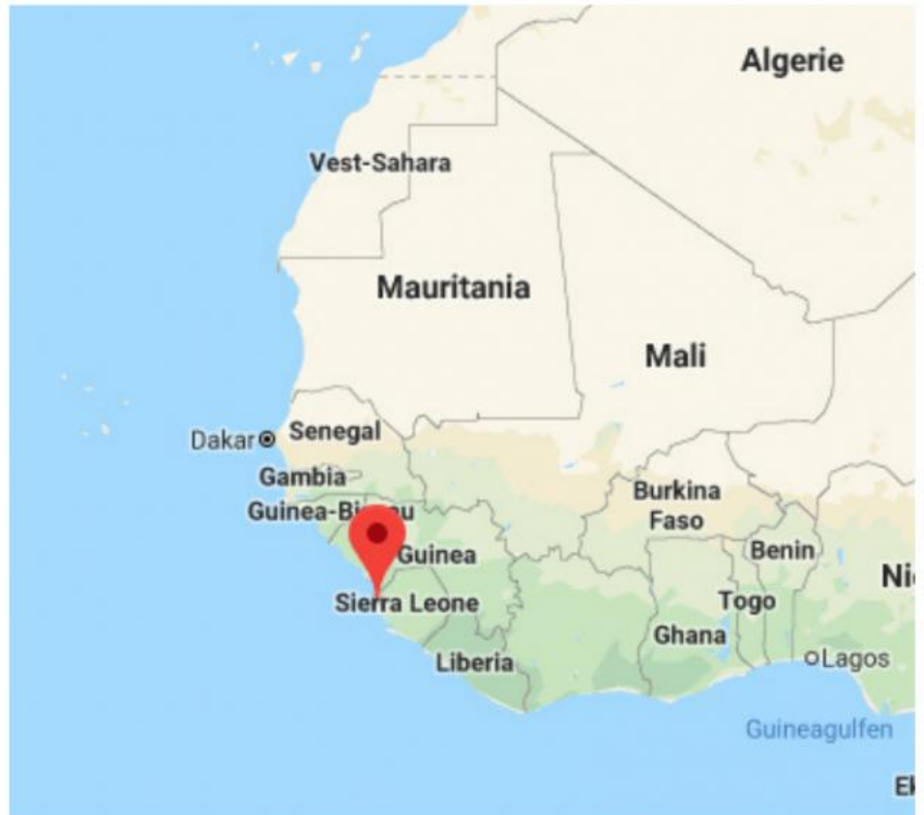
Viktor Schützes treffsikkerhet sendte Polyana til bunns om lag 400 kilometer vest-sørvest av Kapp Verde. Skipet skulle til Freetown, Sierra Leone, med kull i lasten.