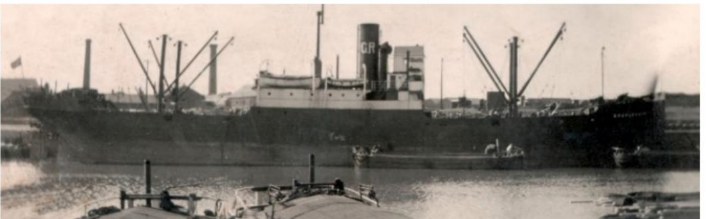
Dampskipet Polyana, som tidligere het Skjoldheim, ble offer for en torpedo fra U-103.