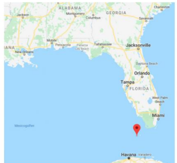
Skipet satte kurs mot Trinidad, men seilasen endte utenfor Key West.

På 1.071 skip i den norske handelsflåte omkom under annen verdenskrig 3.670 nordmenn og 977 utlendinger. Ifølge Churchill og Roosevelt var de norske krigsseileres innsats mer verdt for de allierte enn én million soldater.