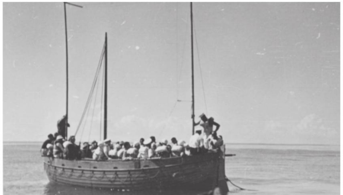
Bildet viser en besetning som har reddet seg over i en livbåt. For mange krigsseilere endte mønstringen i en våt grav.

Kilder: Stiftelsen Arkivet og Krigsseilerregisteret.no