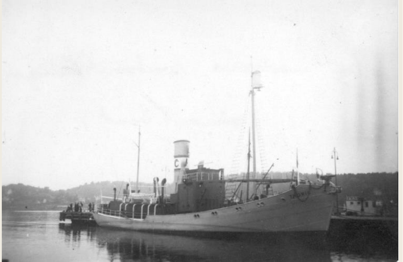
SFJ00219360120001 DS/Hvb AMOS (senere THORIS) ved Tollbodkaien.