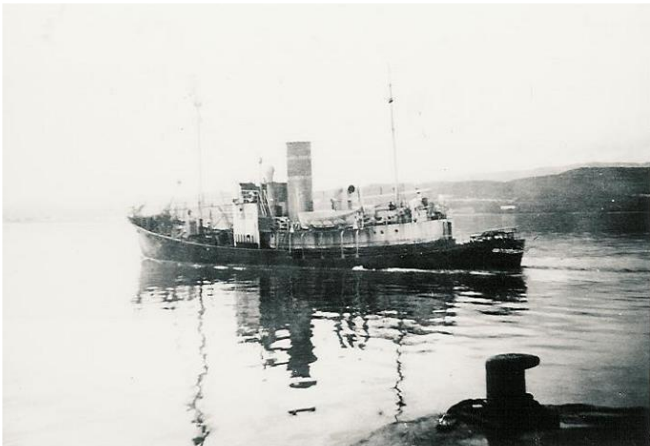
SFJ00219360120002 DS/Hvb THORIS som fangstbåt POLARBRIS IV ved Skjelnan hvalstasjon.