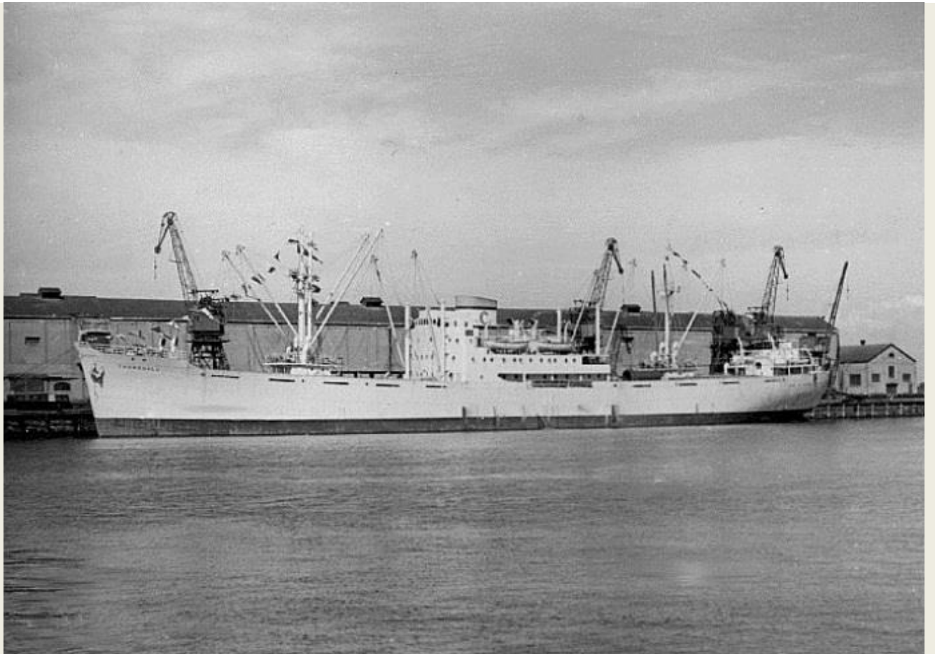
00219480420001 MS THORSHALL. A Beautiful Lady, indeed!