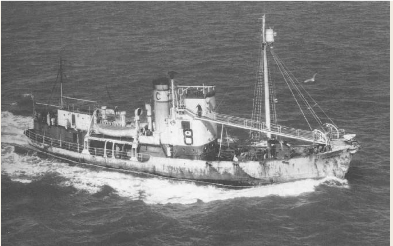
SFJ00219500420001 DS/Hvb PINGVIN. Privat samling