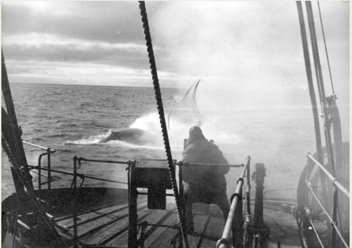
SFJ00219510555001 ODD XIII (1). Skuddet går!