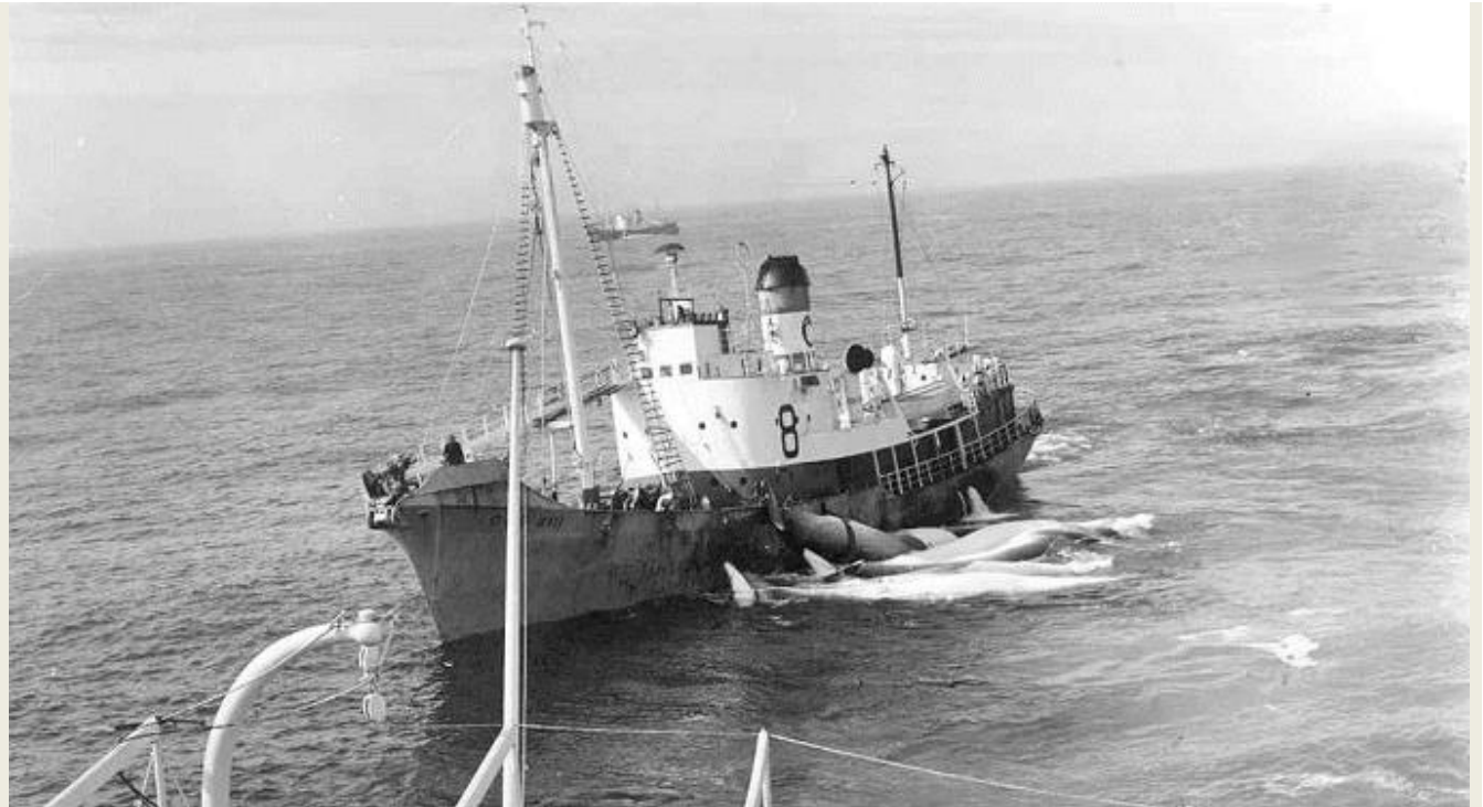
SFJ00219510520001 ODD XIII (2).