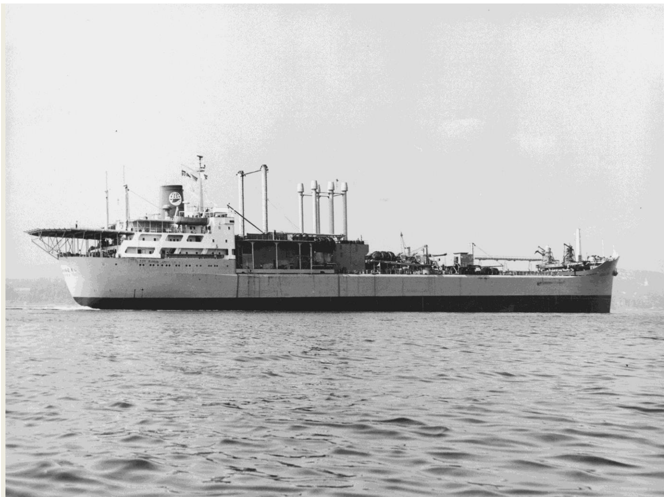
OSL34219700120002 NORGLOBAL (3).