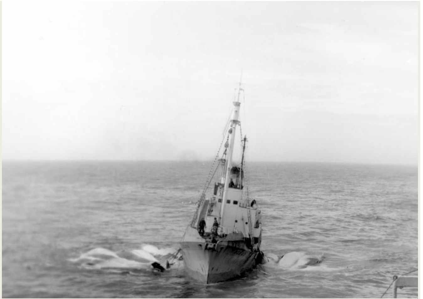
SFJ00219510520001 ODD XIII (3) som bøyebåt.