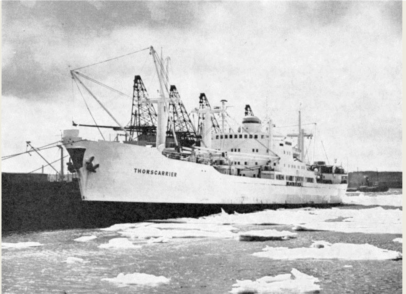
SFJ00219590220005 THORSCARRIER.