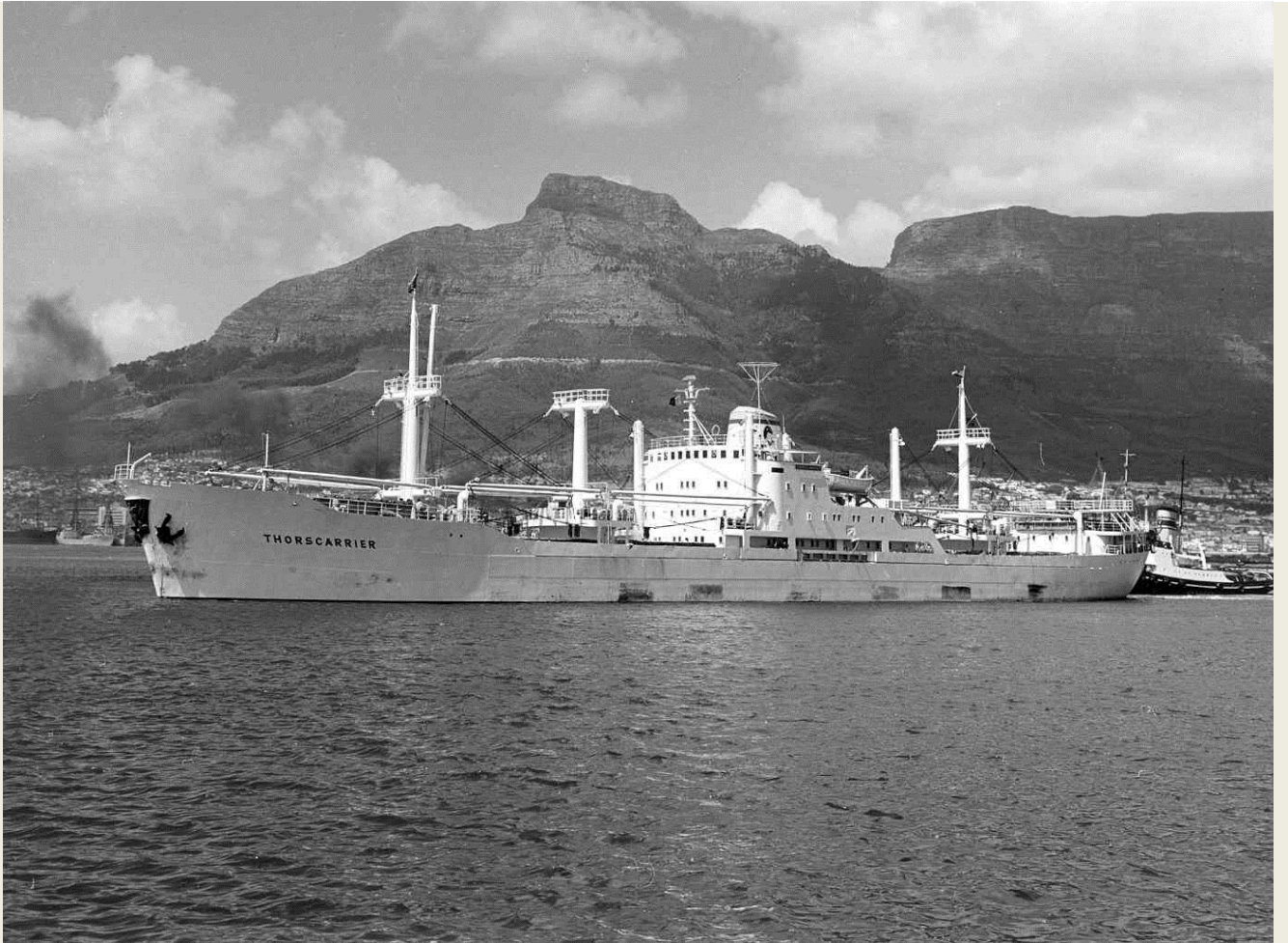
SFJ00219590220003 MS THORCARRIER i kjente omgivelser for mange.