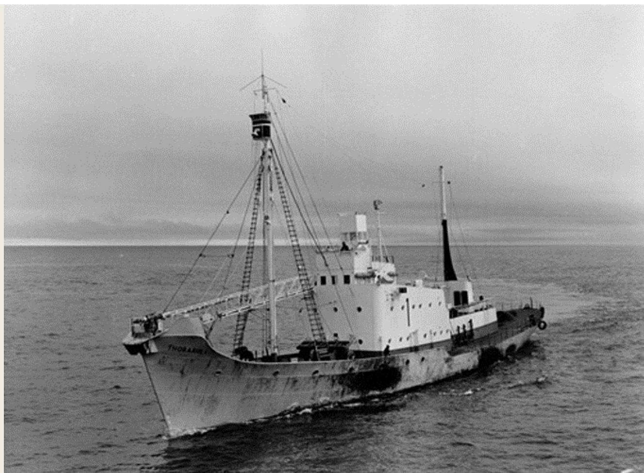
SFJ00219640420001 MS/HVB THORARINN.