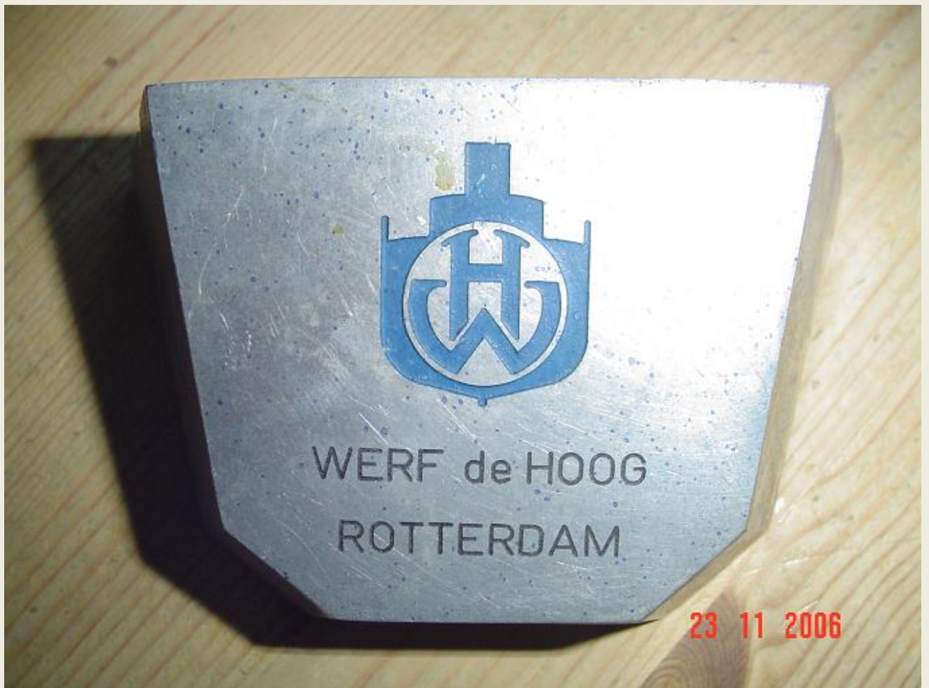
SFJ00219640411602 MS/HVB THORARINN (2). Merke fra byggeverksted.