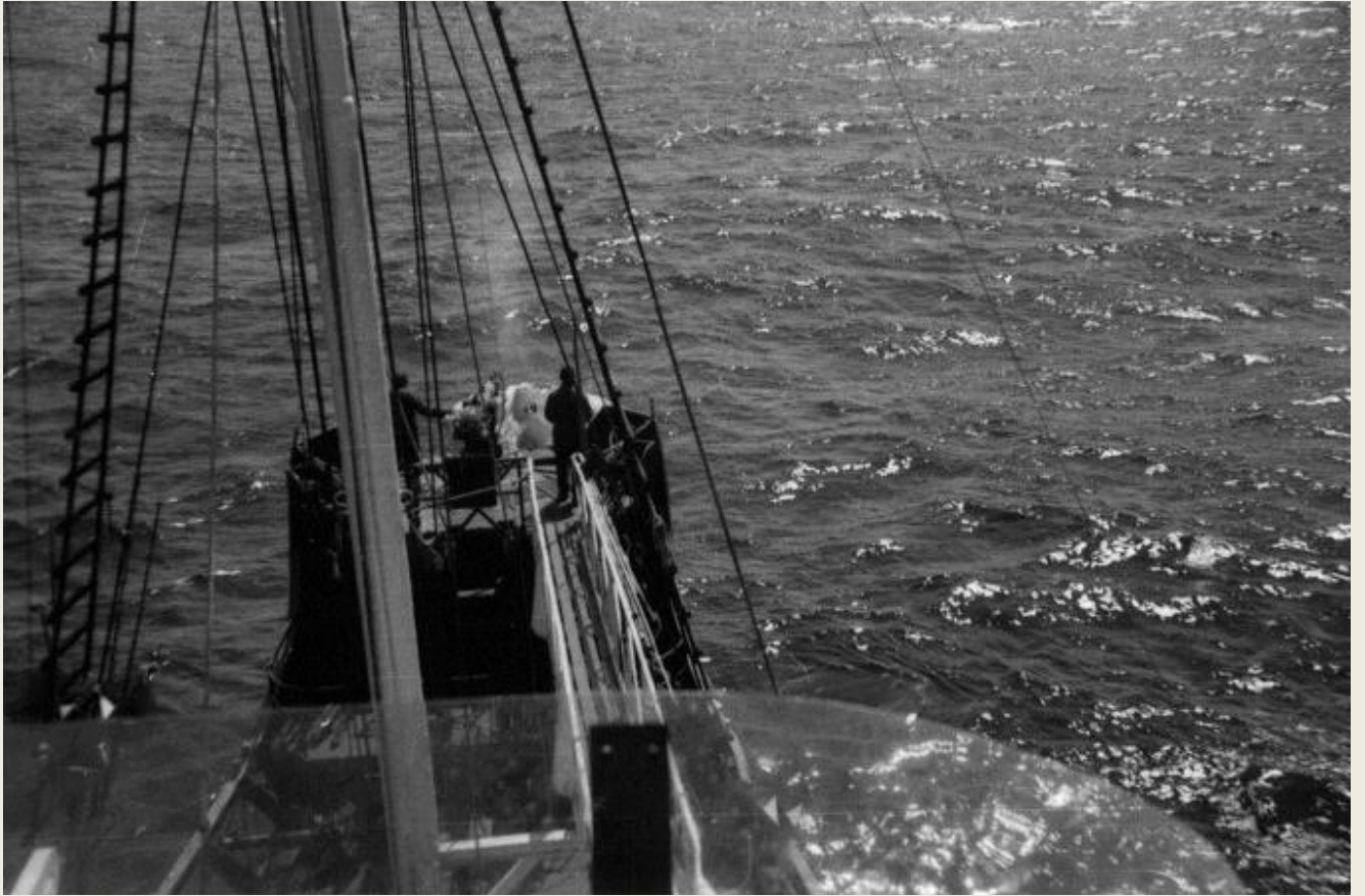
SFJ00219640420002 MS/HVB THORARINN (3) på jakt i Halifax, men den var for liten.