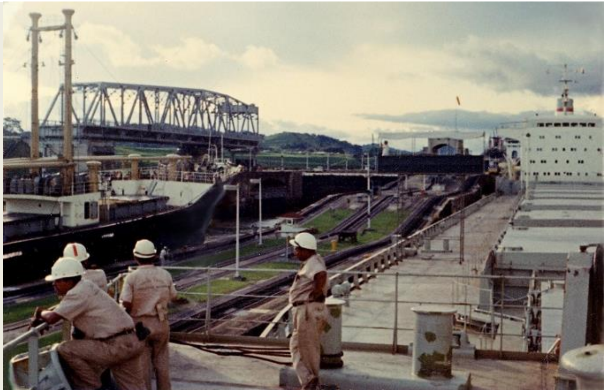
SFJ00219670120009 MS THORSRAKE på vei gjennom Panama-kanalen.