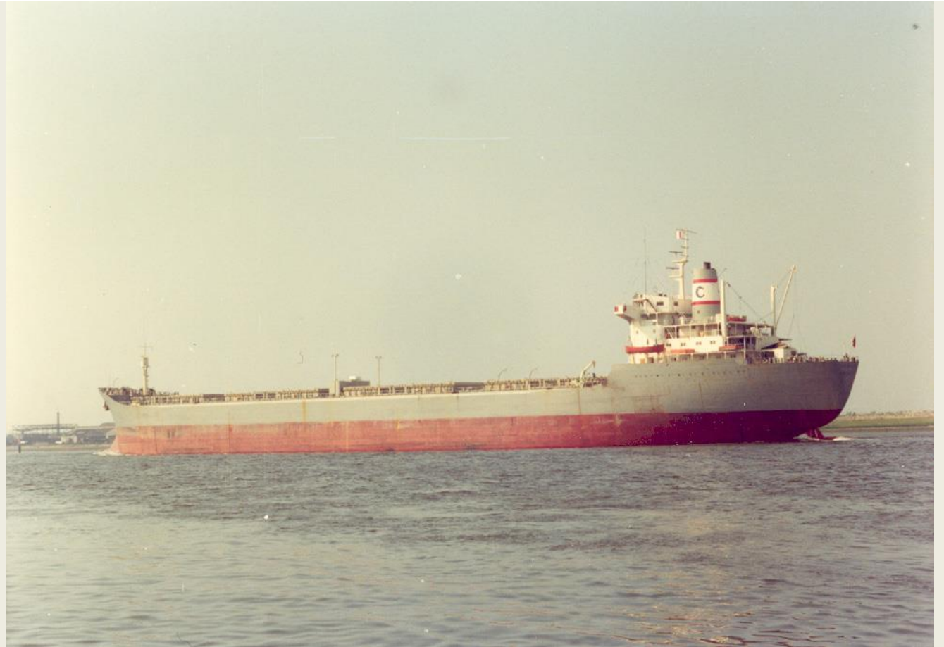
SFJ00219670120006 MS THORSRAKE.