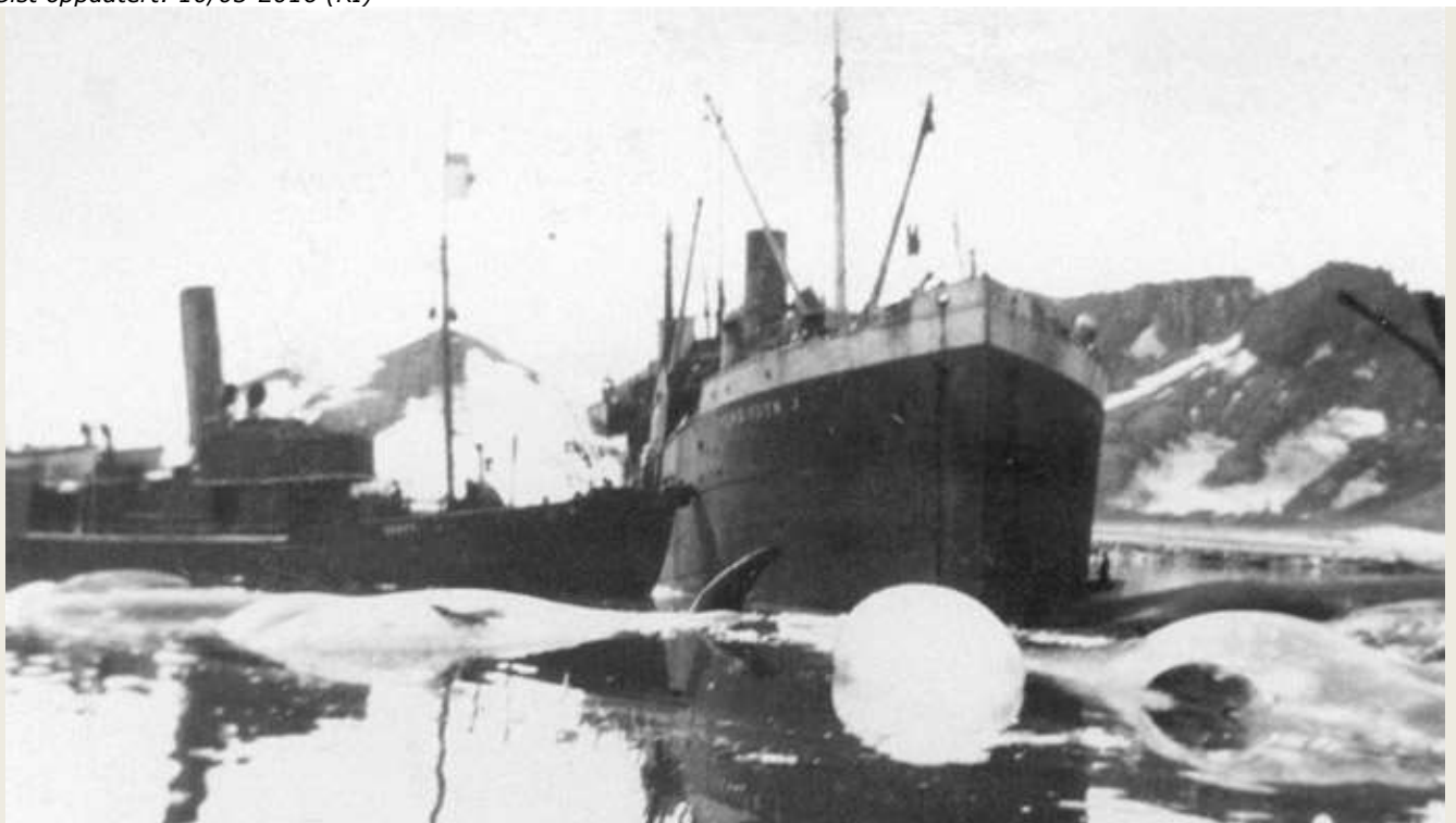
SFJ00319140220002 DS/FIK SVEND FOYN I. SELVIK ER INNE OG LEVERER HVAL.