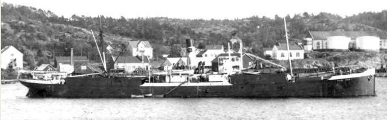
SFJ00319140220003 DS/Fik SVEND FOYN I.