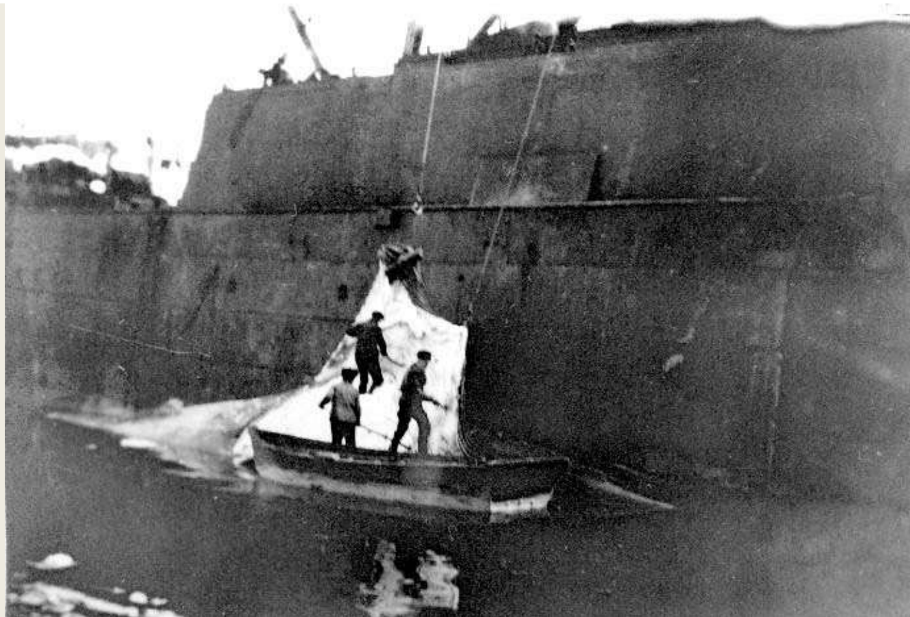
SFJ00319140220003 DS/Fik SVEND FOYN I. Utenbords flensing.