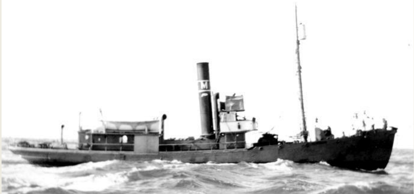
SFJ00319141420001 DS/Hvb NORRØNA II under A/S Mexico's eie.