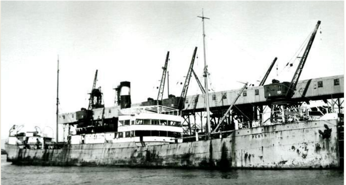
SFJ00319210120001 DS/Fik PERTH.