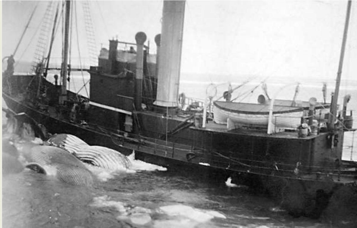
SFJ00319270120002 DS/HVB STAR X leverer hval.