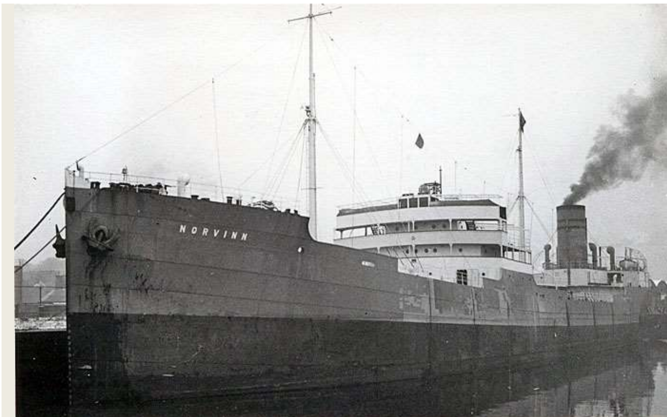
SFJ00319300520001 NORVINN.