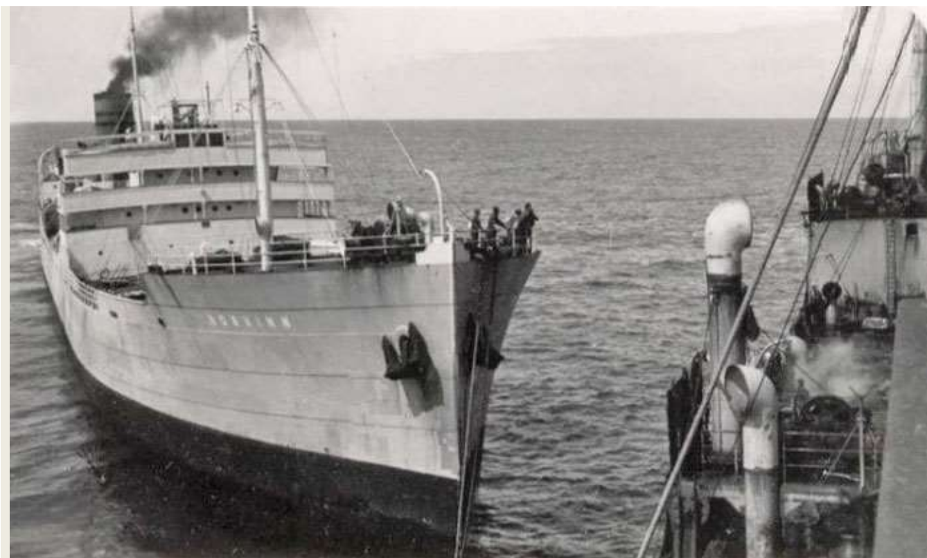
SFJ00319300520004 NORVINN.